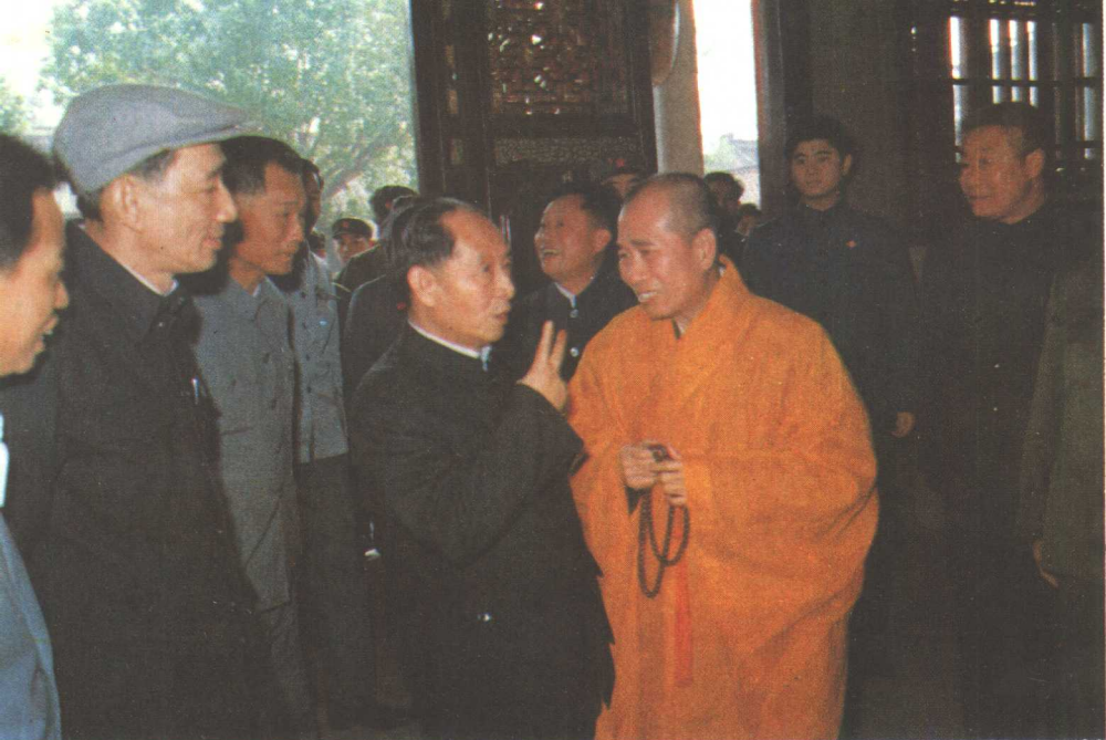
1984年2月5日，胡耀邦视察广东省潮州开元寺与法师交谈