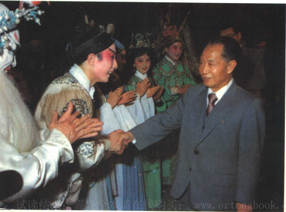
1985年6月10日，胡耀邦在杭州接见了越剧、昆剧演员