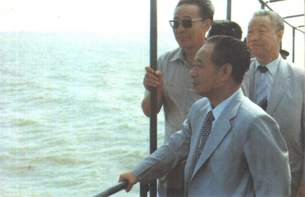
1984年5月，胡耀邦在前往珠海特区的途中，眺望南海珠江口