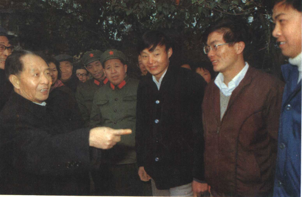
1984年2月6日，胡耀邦在广东梅县东山中学与学生交谈