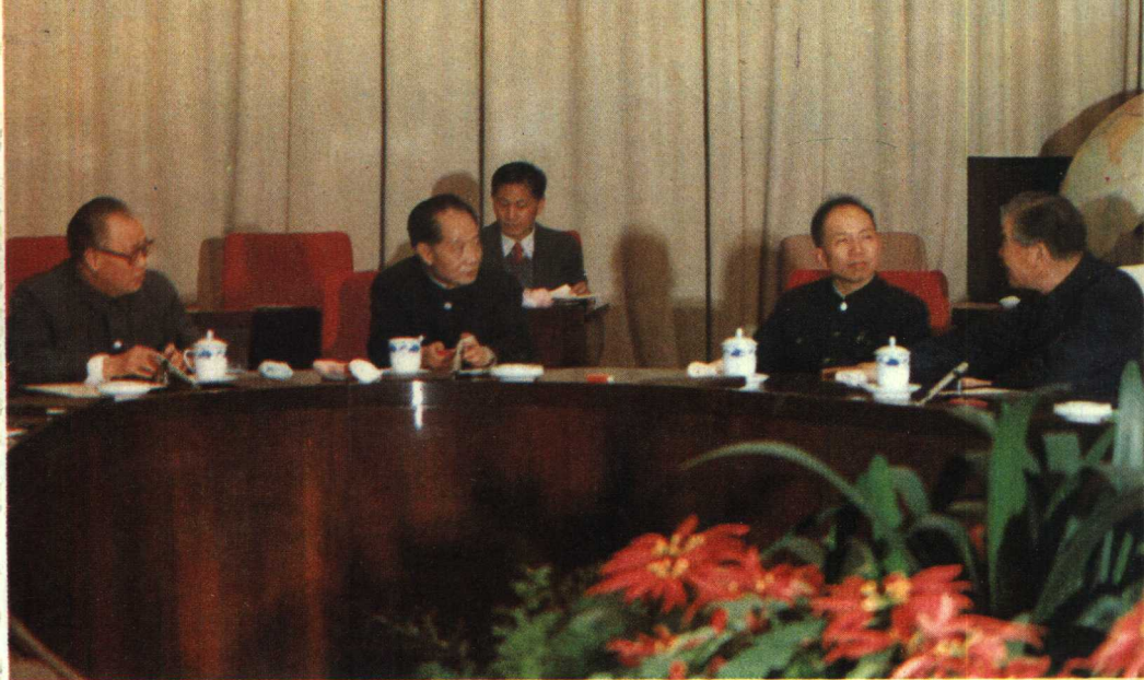
1985年3月13日，胡耀邦、赵紫阳等同科技人员座谈