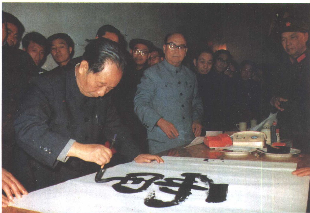
1984年6月29日，胡耀邦为白山水电站题字