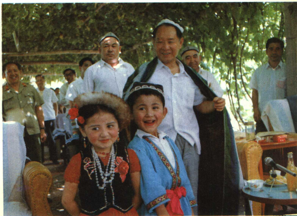
1985年7月，胡耀邦与维吾尔族儿童在一起