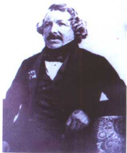
图 1 达盖尔的银版肖像