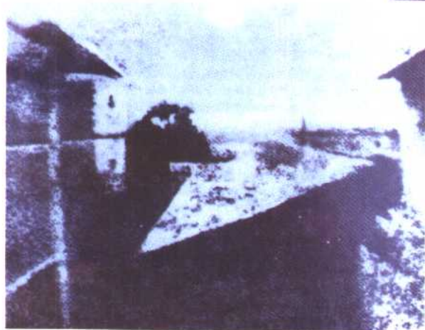
图 2 鸽子窝 尼埃普斯 摄