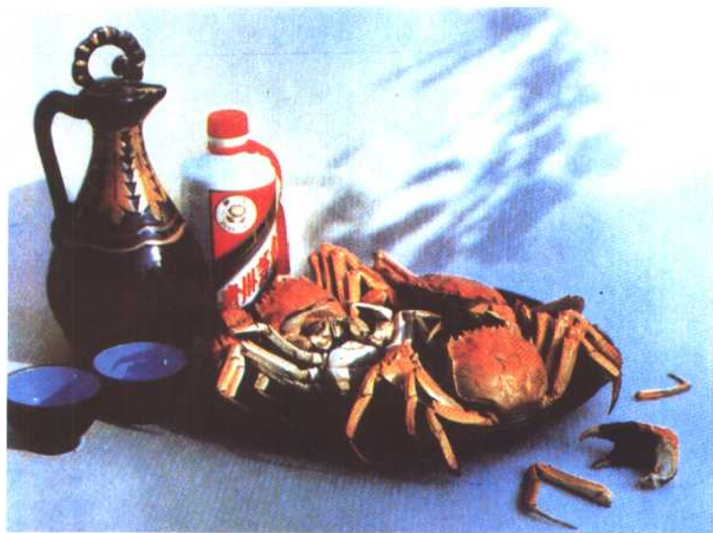
图 17 十月的螃蟹