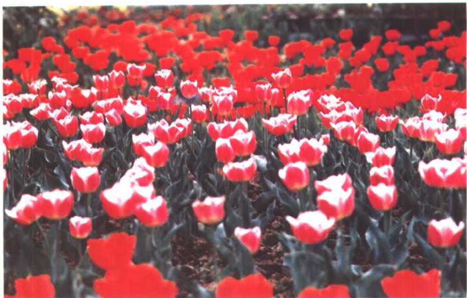
图8 郁金香