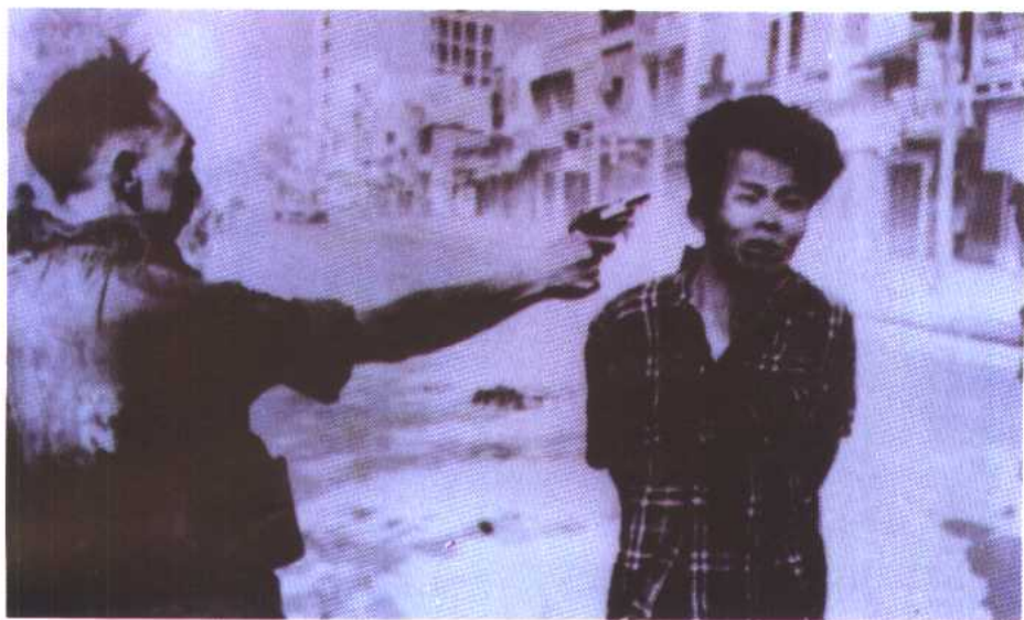
图 27 枪杀越共