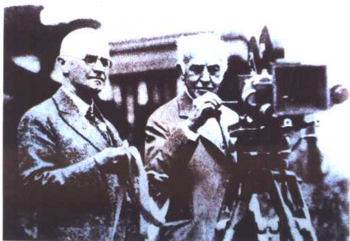
图 3 伊思曼（左） 与爱迪生