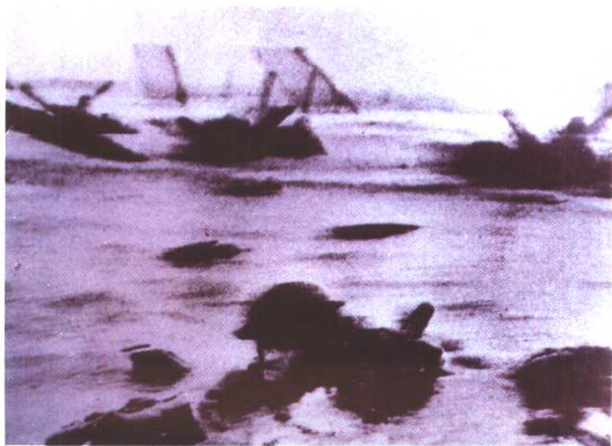
图 18 诺曼底登陆