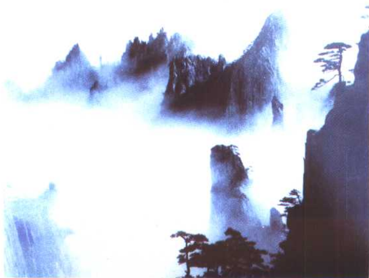
图 7 群峰竞秀