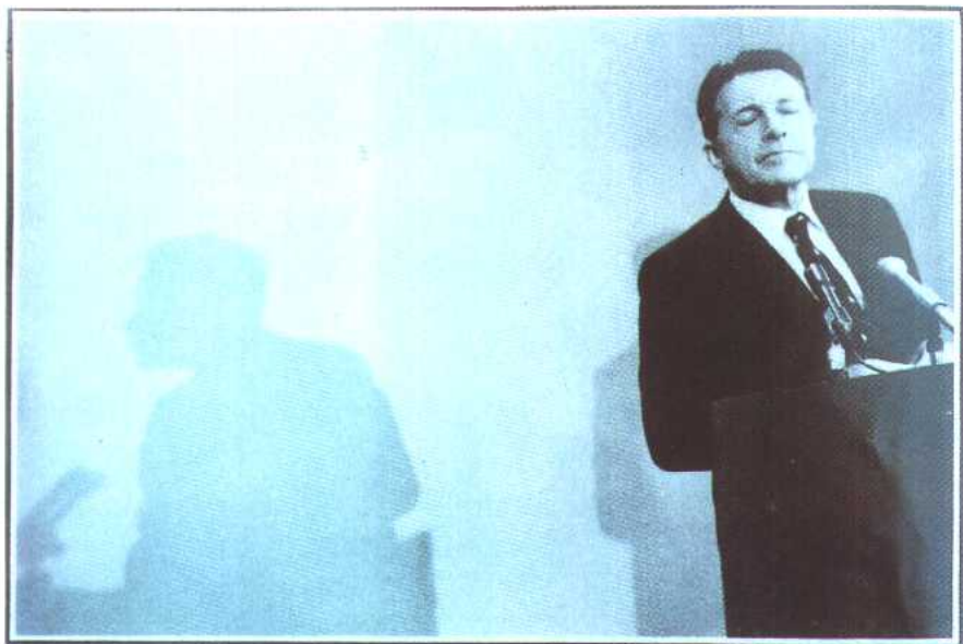
图 19 温伯格