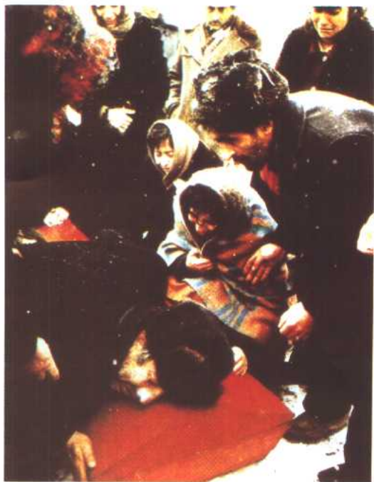
图 21 亚美尼亚的葬礼