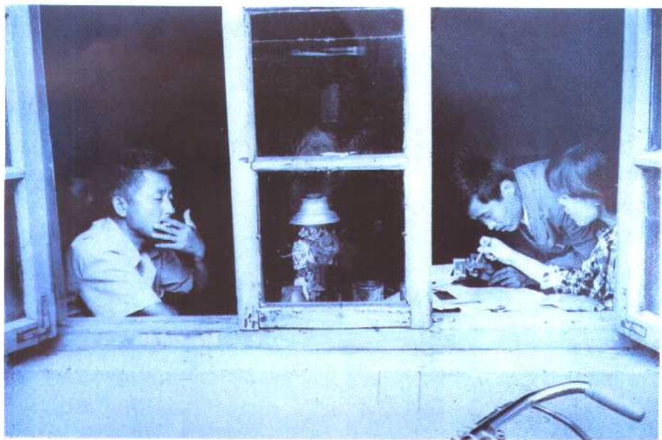
图 28 倒闭后的滋味