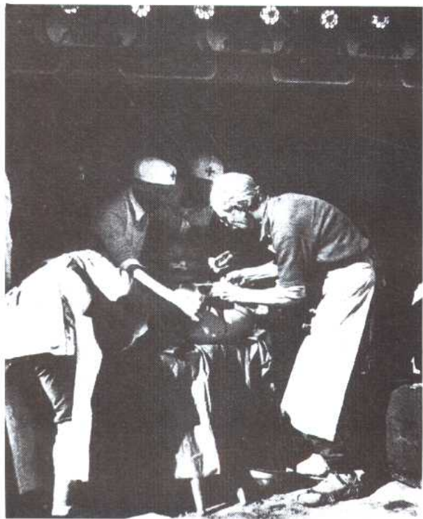
图 14 白求恩大夫