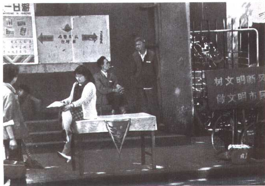
图9 监督岗