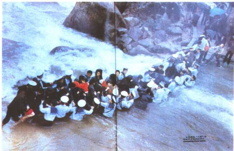
图 15 水兵搭起的人桥