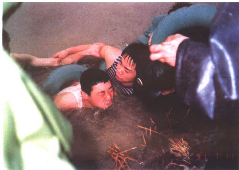
图 26 中流砥柱