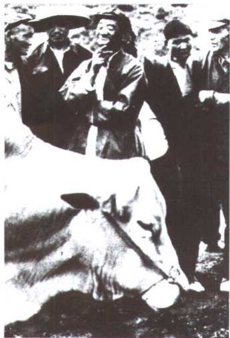
图 25 行家