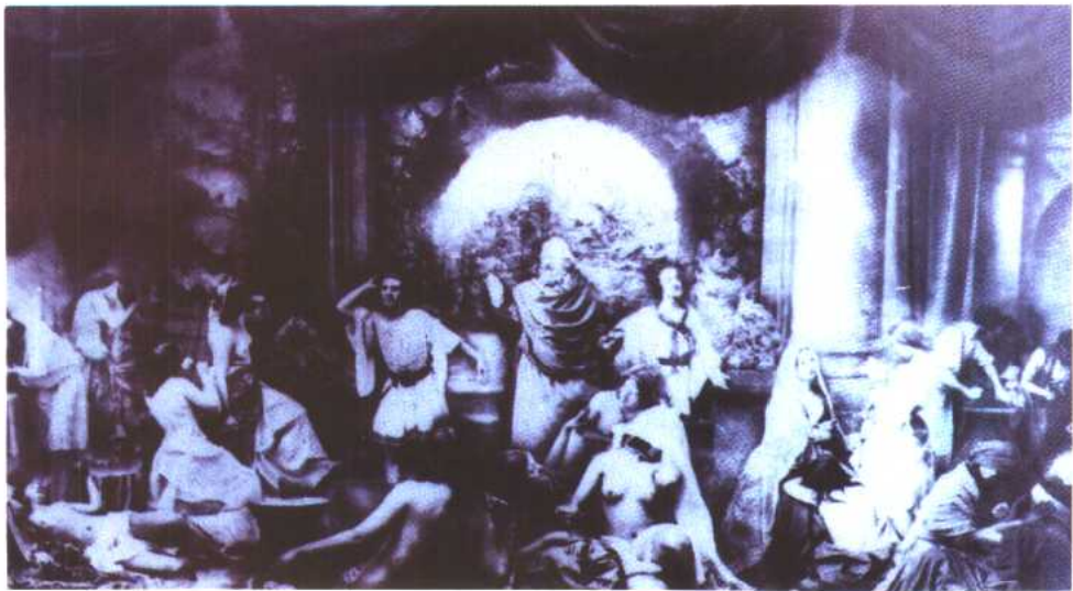
图 13 两种人生