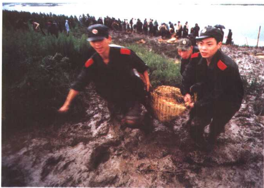
图 10 军校大学生的考场