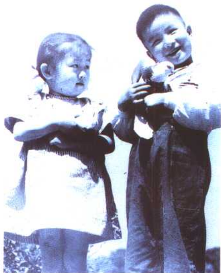
图 6 我们热爱和平