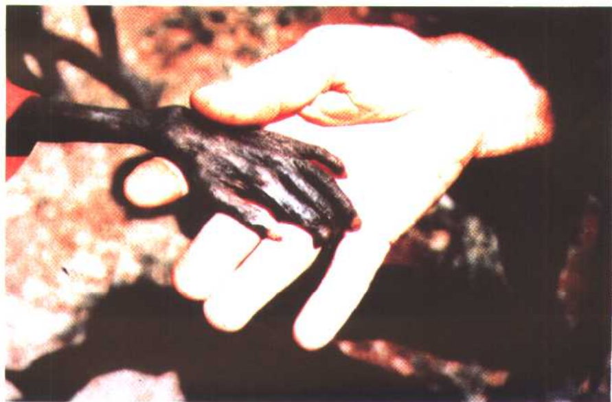
图 20 乌干达干旱的恶果