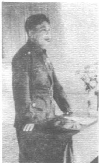
蒋经国是青年军的首领