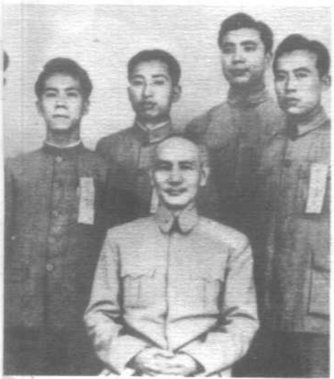
右 蒋介石夫妇与陈纳德 左下 蒋介石与青年 左中 三青团成立大会 左上 蒋介石与青年军将领