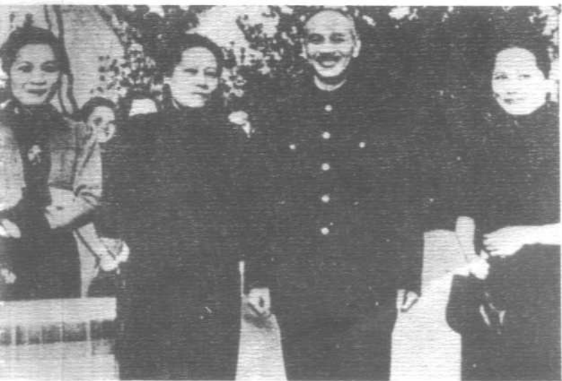
蒋介石与宋氏三姐妹