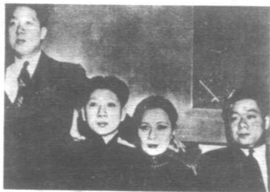
右上 军调部三人小组