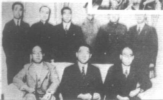
下 汪伪政权 主要成员