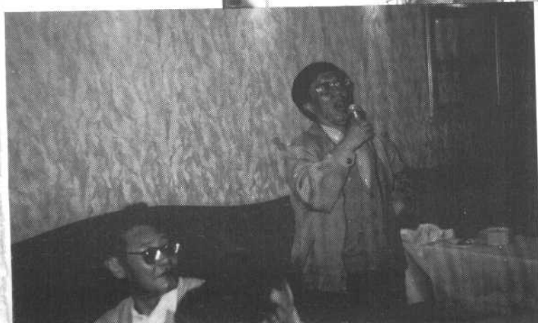
◁1996年2月，在 一次文艺界活动 中娱乐。