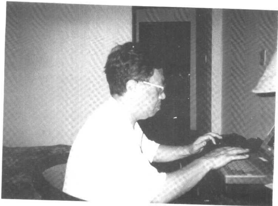
△1995年夏，在威海东山宾馆写作。