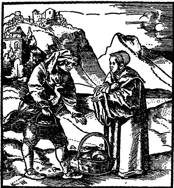
领主向农民征收谷物、鸡蛋和家禽