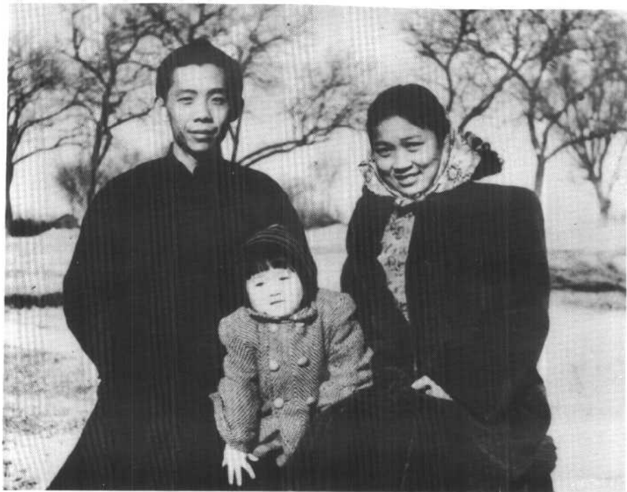
1946年冬和夫人何孔敬及女儿在清华大学校外。