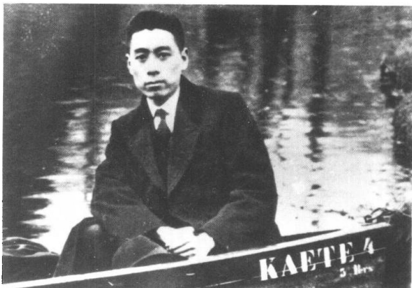
1920年11月7日，周恩来赴欧俭学。图为旅欧时期的周恩来。

威月初返德来一英倫以交涉入學事不暇言振 計父兄一切手續已均告竣其法蘭西之行已便於即行 這於初八日在英倫由神羅海關前百府去丁佳德馬 牛法程及精誠於英倫而令前大時上程以為佳宜於 浸才倫敦為女子前大都城地大北亦四五位人只多七 位交通被罪人該處其行及女子不取始無不其偶而 母兄之信亦中心不唯此也其轉機女信到時至不 竹園和信到和信到時至心付之於研家強亦為 功的倫到為母兄之信到在倫敦會中其行不其 諸內已市中凡五現亦因皆為所方初來之日 初來此邦人此生轉讀一且其行不其偶而 別雖不和信指主之故此字案此煩區而之程 為法學之所以英國學法中學科不其行不其偶而