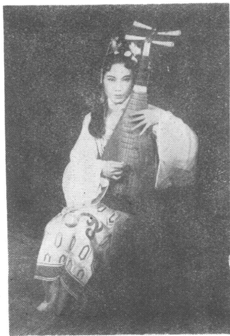
《凄凉辽官月》剧照(1946年)