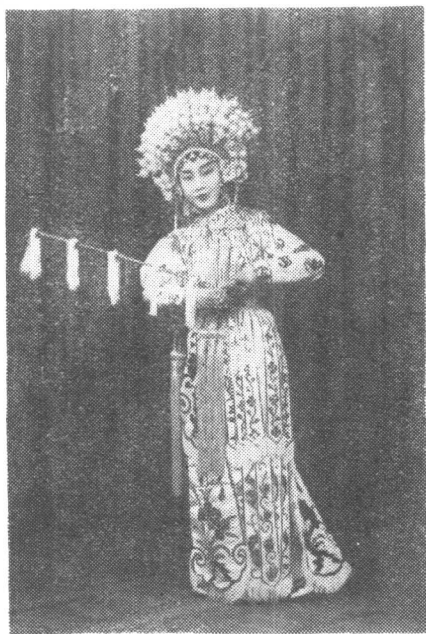
《双阳战狄青》剧照(1939年)