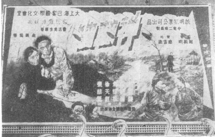
电影《祥林嫂》海报 (1948年)