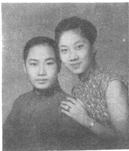
袁雪芬(左)与马樟花 合影(1941年)