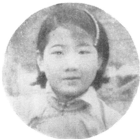
十三岁时的袁雪芬 (1935年)