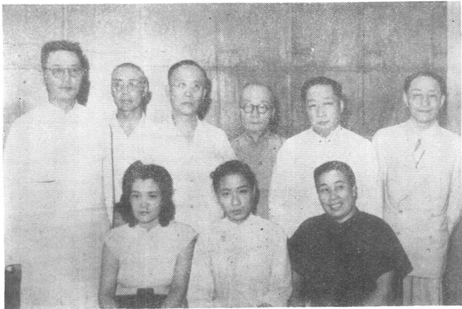
袁雪芬参加记者招待会后留影(1946年)