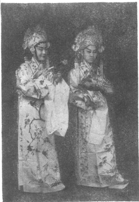
袁雪芬(左)与马樟花合演的《梁祝 哀史》中“十八相送”剧照(1939年)