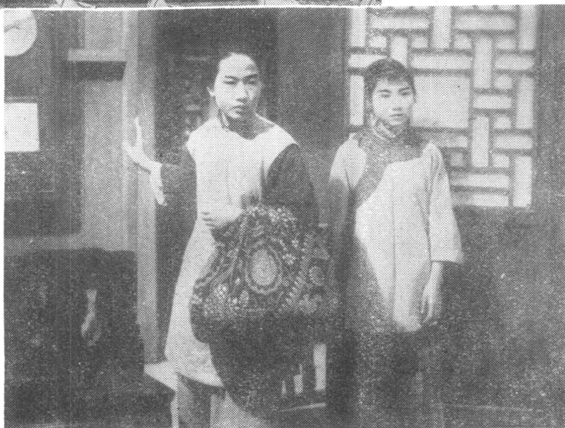
上图：电影《祥林嫂》剧照(1948年) 左图：《时事新报》一九四六年四月二十八日的报道