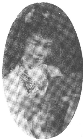
《西厢记》剧照(一九五五年)