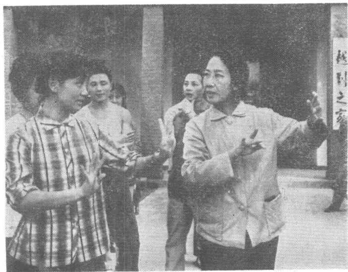
袁雪芬在嵊县「越剧之家」辅导学员 （一九七八年）