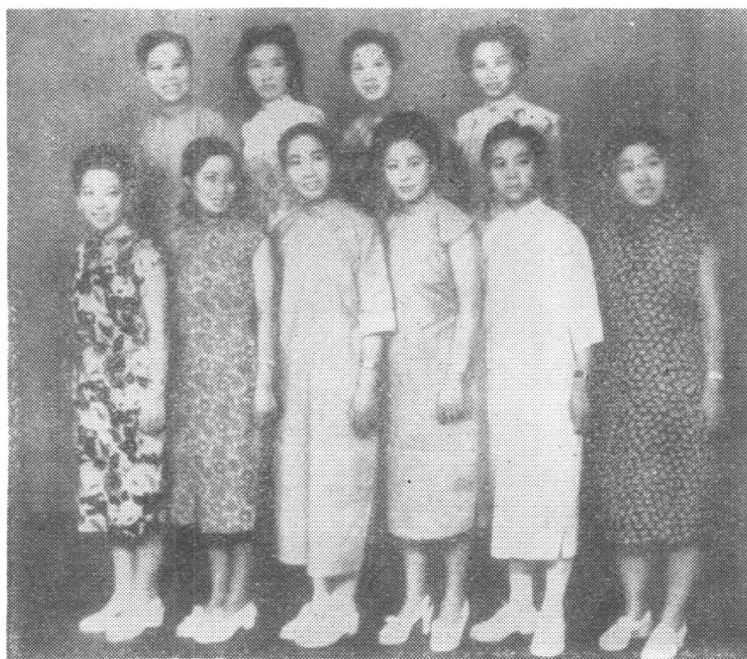
越剧“十姐妹”合影(1947年)

前排(左起): 徐天红、傅全香、袁雪芬、竺水招、范瑞娟、吴小楼 后排(左起): 张桂凤、筱丹桂、徐玉兰、尹桂芳