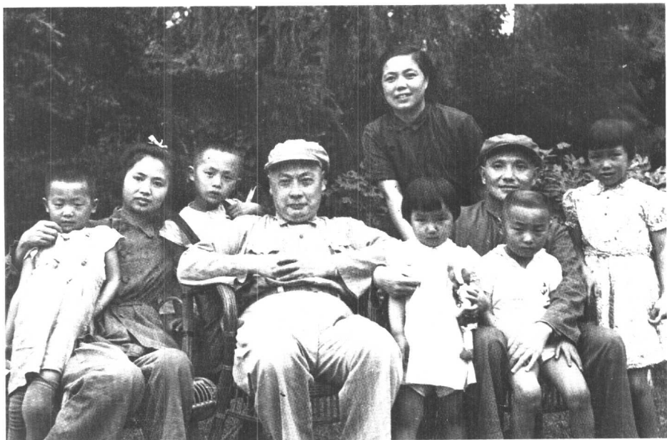
8 1949年5月，陈毅、邓小平两家在上海