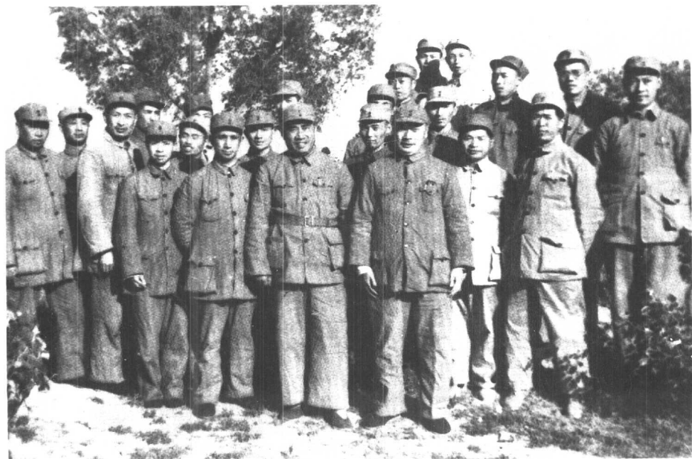
5 1948年5月，陈毅、粟裕陪同朱德总司令与华东野战军及一兵团部分干部合影