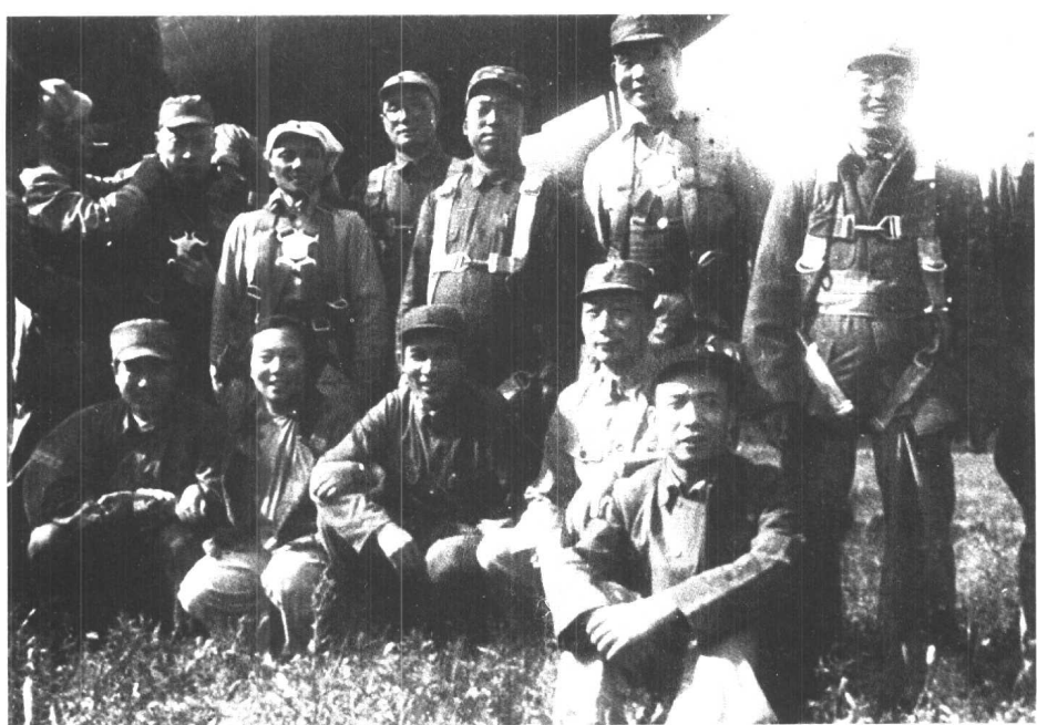
4 1945年8月25日，陈毅（后左2）与邓小平、刘伯承等飞离延安前，在机场与李富春、聂荣臻等合影。杨尚昆正为陈毅整理着装