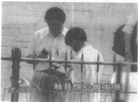
票贩子手中的发票各式各样,门类齐全