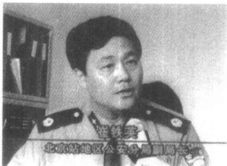
495 本增值税的发票,如果按高款项填写,将给国家造成 425 亿的税款流失