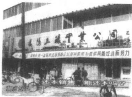
最先搞起“还本销售”的陕西咸阳五环实业公司

如果一家日销售额仅为 4000 元的商场，一夜之间，其日销售额猛增为 60 万元，而且还会继续攀升，你可能不相信，但你不相信的事却真的发生了，而且不是发生在一家商场，而是发生在几家甚至几十家商场中——看来人间真有神话。