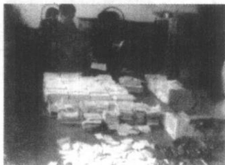
部分被收缴的假发票及造假发票工具