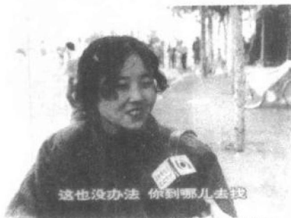
这位因所购物品出现质量问题、前来查询的顾客苦笑着说,这也没办法,你到哪儿去找

那就是将还款的希望寄托在一个赚大钱的新项目上,但这些新项目的可行程度和可信程度都是未知数。