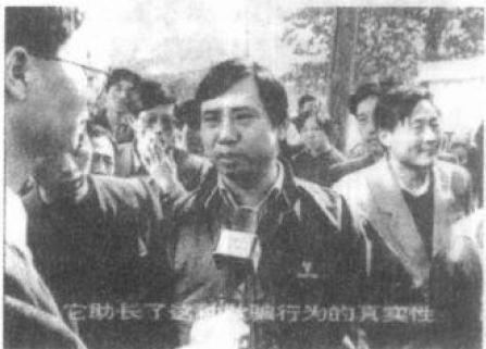
这位消费者认为，公证机关客观上助长了这种欺骗行为