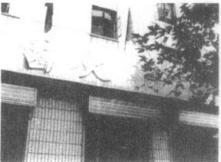
这家曾经搞过还本销售的华利商行，已人去楼空变成了火锅店