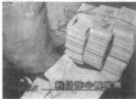
如果这些假发票流入社会,不知将给国家造成多大的损失