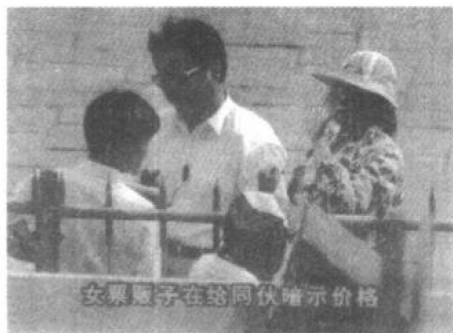
女票贩在向同伙暗示:3张发票50元