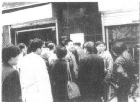
面对贴出来的不能履约的布告，消费者都有一种被欺骗的感觉