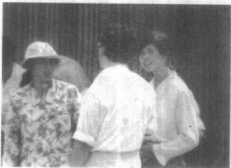
乔装成出门在外的记者在上海火车站一出现,很快被票贩子盯上