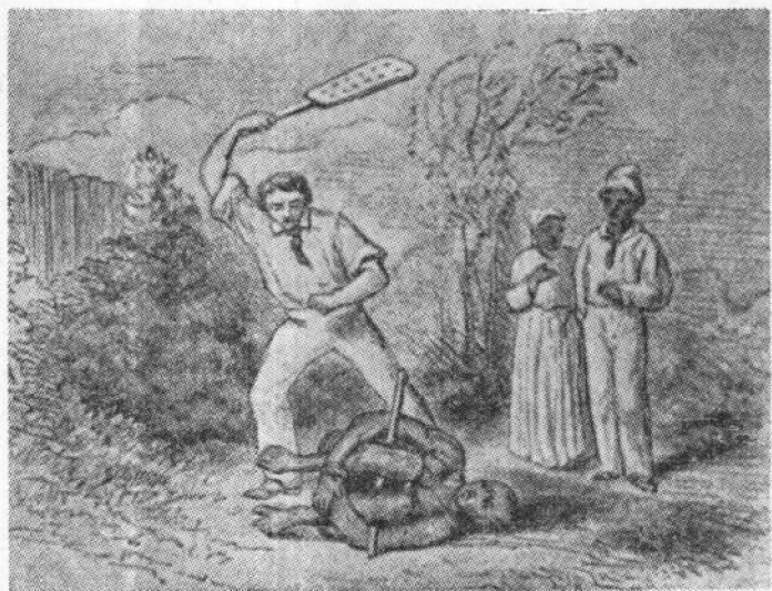
种植场内毒打黑人的情景

死。在弗吉尼亚州还规定，黑人晚间九时后外出，要受四裂之刑。在种植场里，奴隶主惨无人道地剥削奴隶。奴隶在监工的皮鞭下从黎明劳动到黄昏，稍露不满，就会受到私刑拷打，甚至虐杀。如果奴隶跑了，监工们就带着猎狗象捕捉野兽一样到处搜捕。由于受到不断的摧残和过度的劳动，一个奴隶通常在种植场上工作八年到十年就被折磨死了。