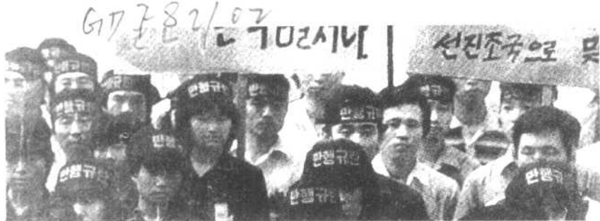
韩民众示威抗议苏联军机击落韩国客机