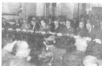
美国、加拿大、英国、法国、荷兰、比利时、卢森堡、挪威、冰岛、丹麦、意大利和葡萄牙等12个国家缔结了北大西洋公约组织