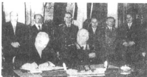
苏联代表莫洛托夫（左）和军事指挥官科诺夫正在签署华沙公约以对抗北大西洋公约组织，后排为东欧代表