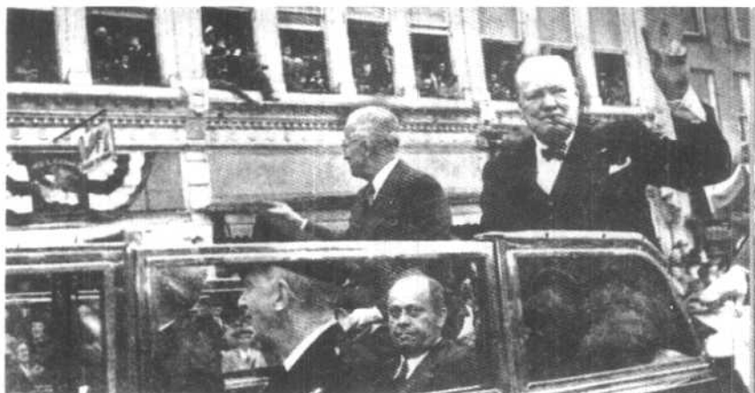
丘吉尔在杜鲁门陪同下前往富尔敦市发表反共演说