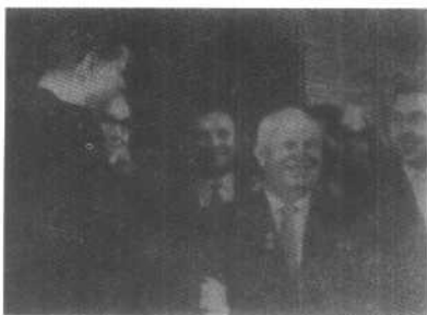
1961年6月，美国总统肯尼迪 (左)和苏联领导人赫鲁晓夫 在维也纳举行会谈