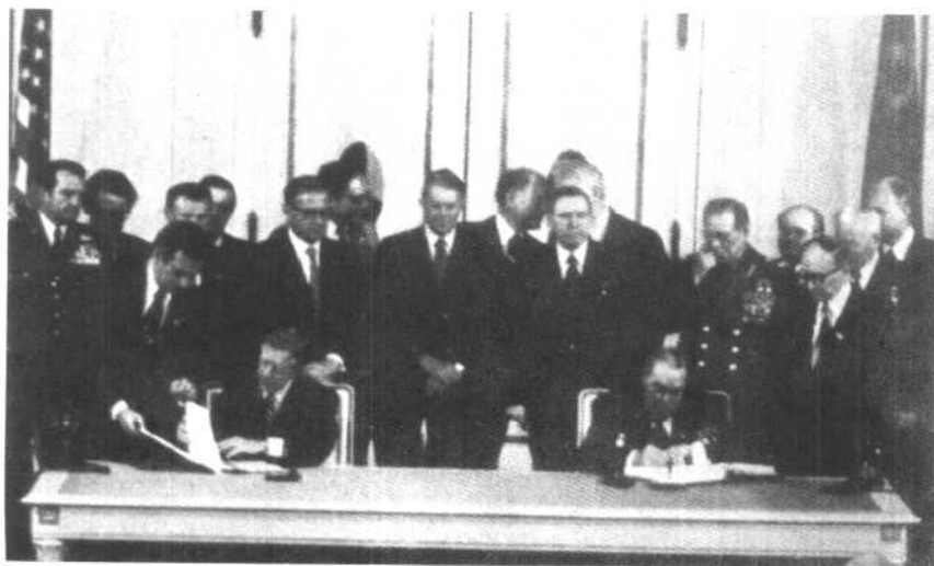
美苏《限制进攻性战略武器条约》签字仪式（1979年6月18日）