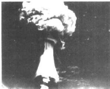
美国第一枚氢弹试爆