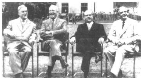
美、英、法、苏、四国首脑在日内瓦为5年期 天的联合国大会峰会议结、束后，在日内瓦 联合声明，艾森豪威尔、肯尼迪、戴高乐、赫鲁晓夫