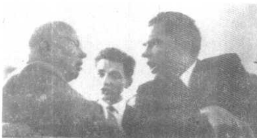
赫鲁晓夫与美国副总统尼克松在苏参观美国厨房模型时，两人发生举世闻名的“厨房辩论”