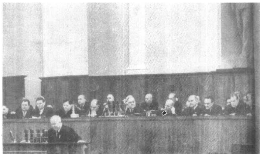
赫鲁晓夫正在苏共二十大上作报告