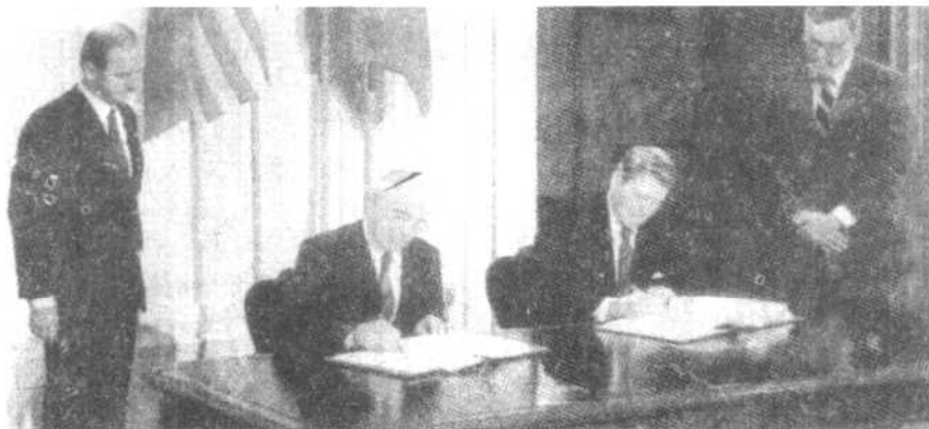
美国里根总统与苏联首脑戈尔巴乔夫签署受世界瞩目的裁军协定