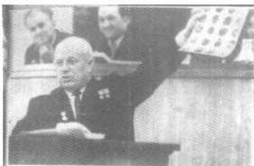
赫鲁晓夫在苏美最高苏维埃会议上指苏联入侵