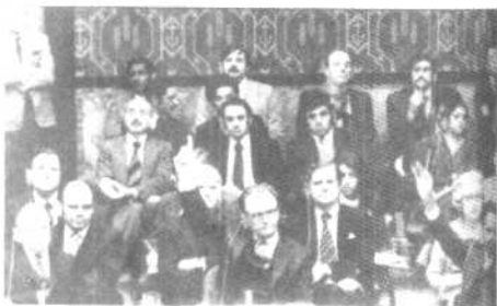
联合国安理会举行紧急会议讨论苏 联入侵阿富汗问题