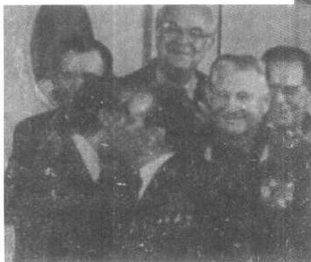
1979年6月,美国总统卡特与苏联领导人勃列日涅夫在维也纳会谈