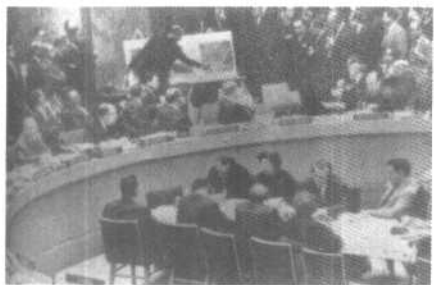
联合国安理会成员国代表观看 从空中拍摄的苏联部署在古巴的 导弹照片