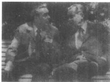
1974年6月，美国总统尼克 松访问苏联时，与勃列日 涅夫在雅尔塔会谈