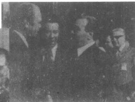
1975年7月,美国总统福特和苏联领导人勃列日涅夫出席在赫尔辛基举行的欧安会首脑会议时,曾举行单独会谈