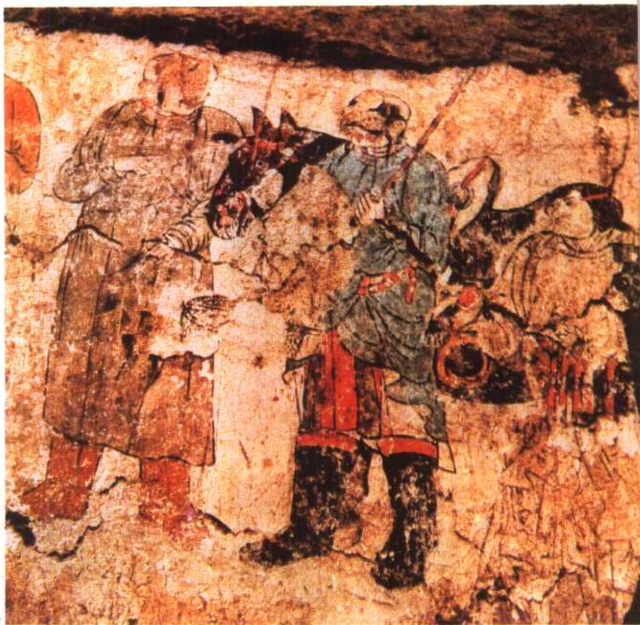
库伦旗一号辽墓墓道南壁里层壁画