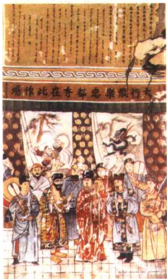
洪洞广胜寺明应王殿内 元代戏曲壁画