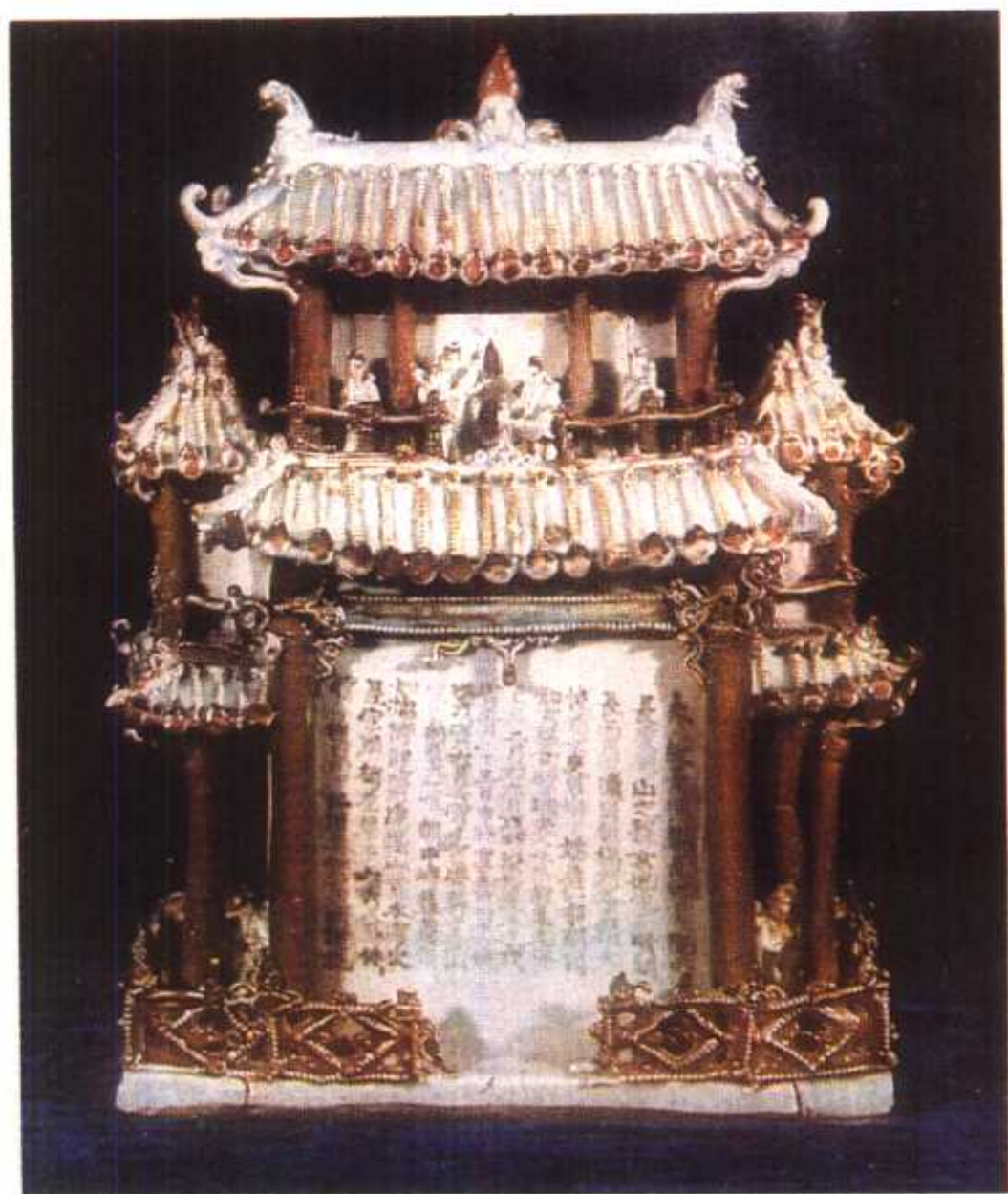
元青花釉里红楼阁式瓷仓