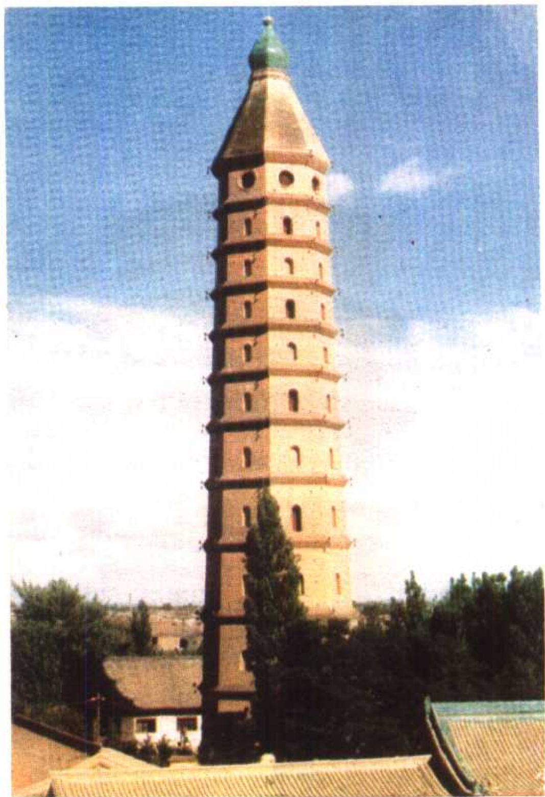
西夏银川承天寺塔