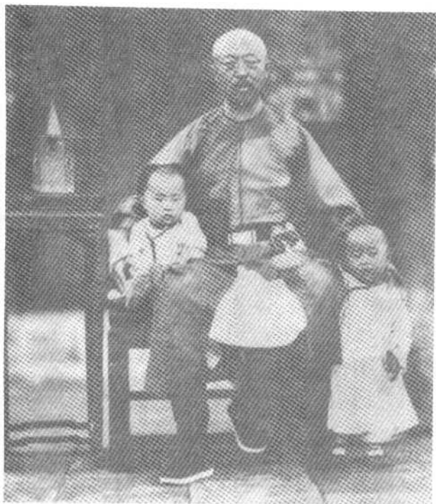
● 载涛之父醇贤亲王——奕譞和他的两个儿子