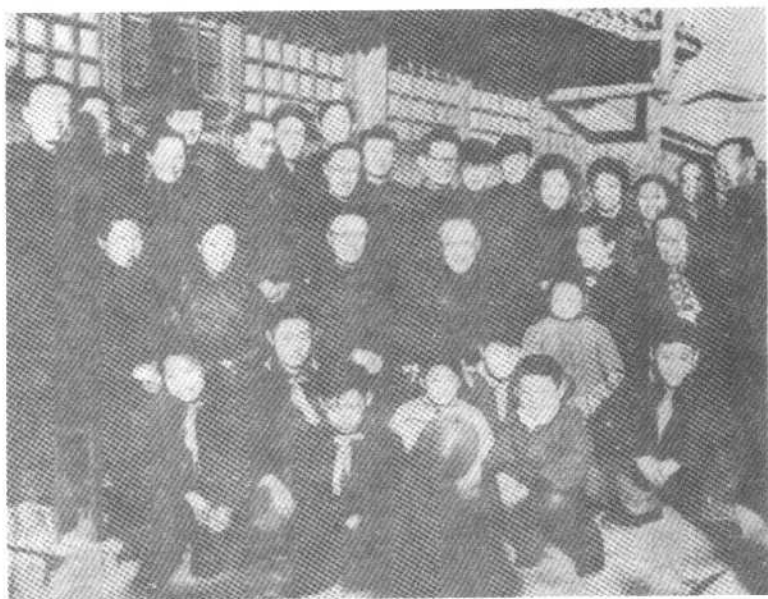
● 老少三代 一九六一年春节在载涛家