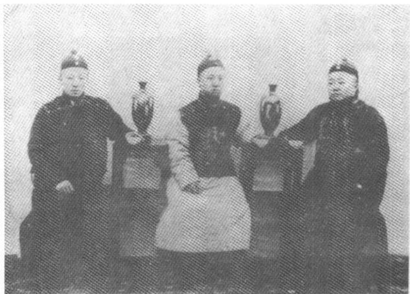
● 载洋（中）载洵（右）载涛（左）