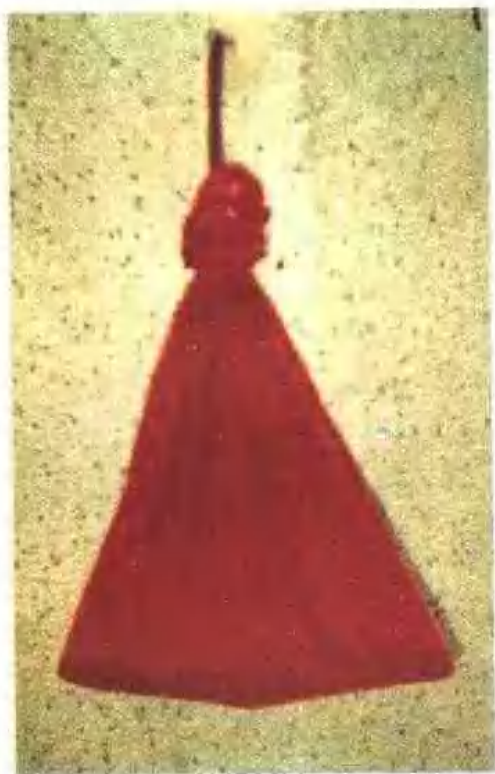
广州市满族特有的「祖宗袋」