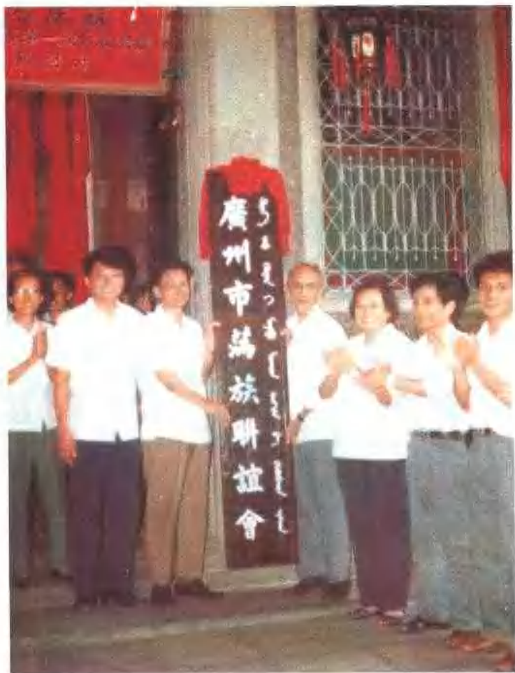
1984年9月18日成立廣州市滿族聯誼會