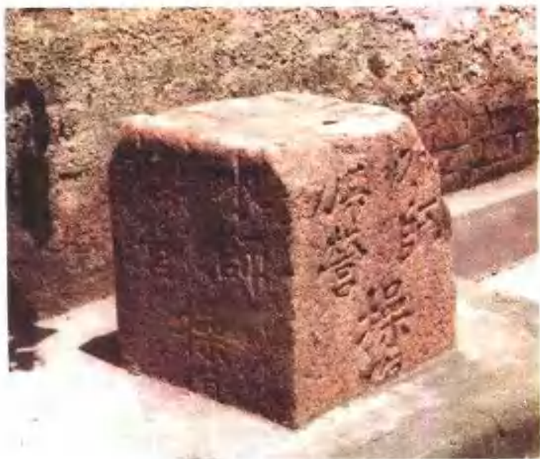
原水师旗营西北界碑