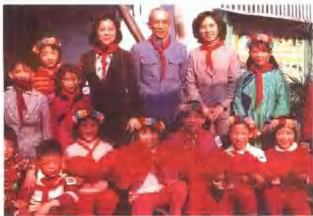
满族小学师生与粤剧名演员