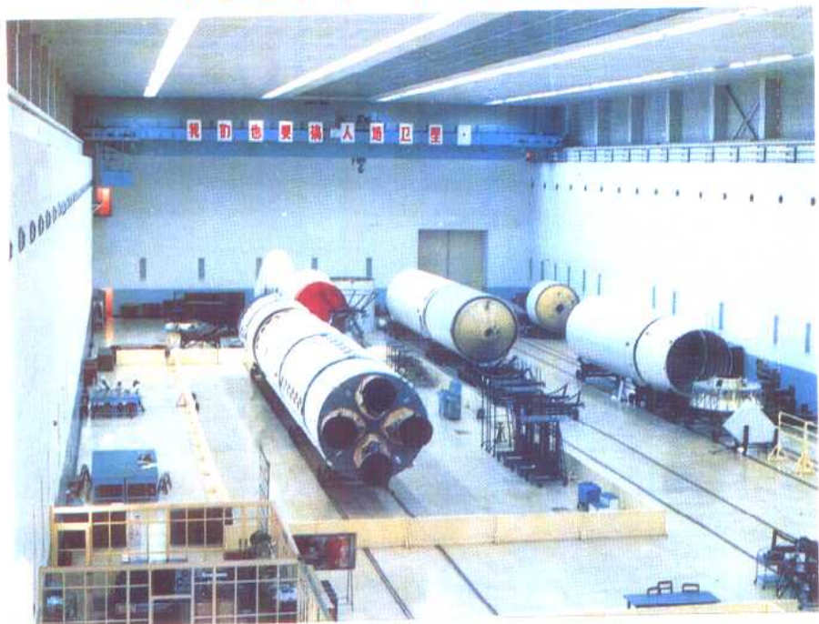
运载火箭总装厂房