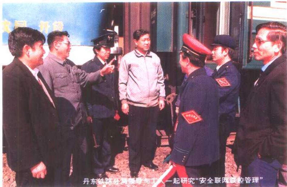
丹东铁路分局领导与工人一起研究“安全联网联控管理”