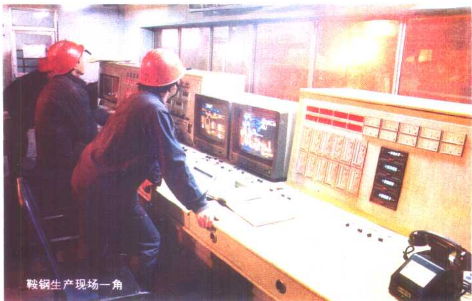
鞍钢生产现场一角