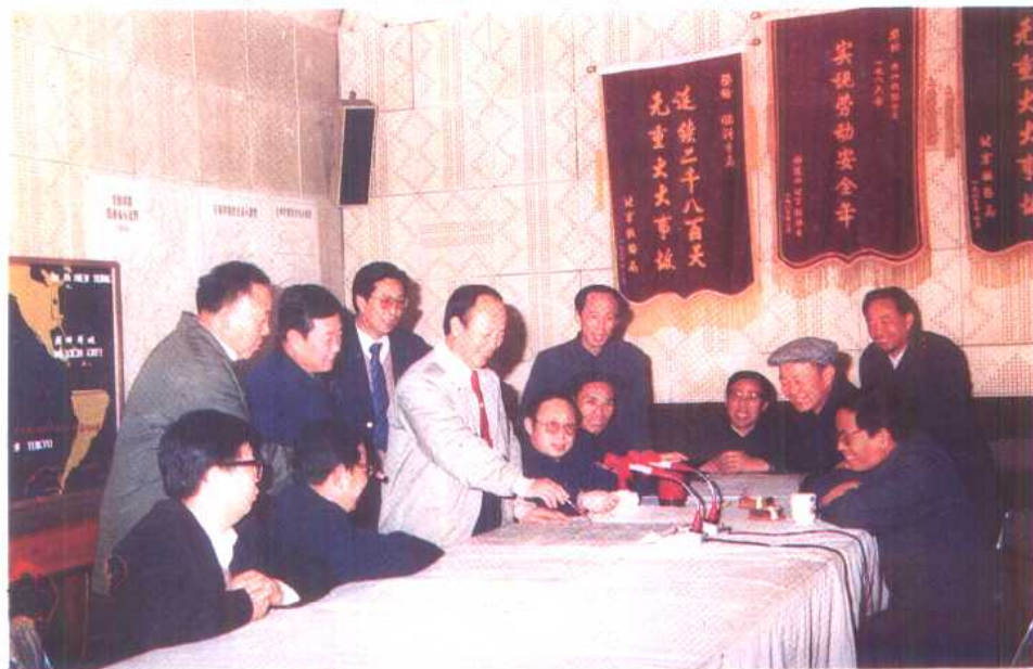
临汾铁路分局领导班子研究完善“群体安全管理”