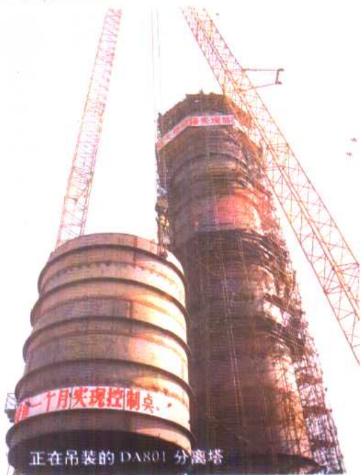
正在吊装的 DAB01 分离塔