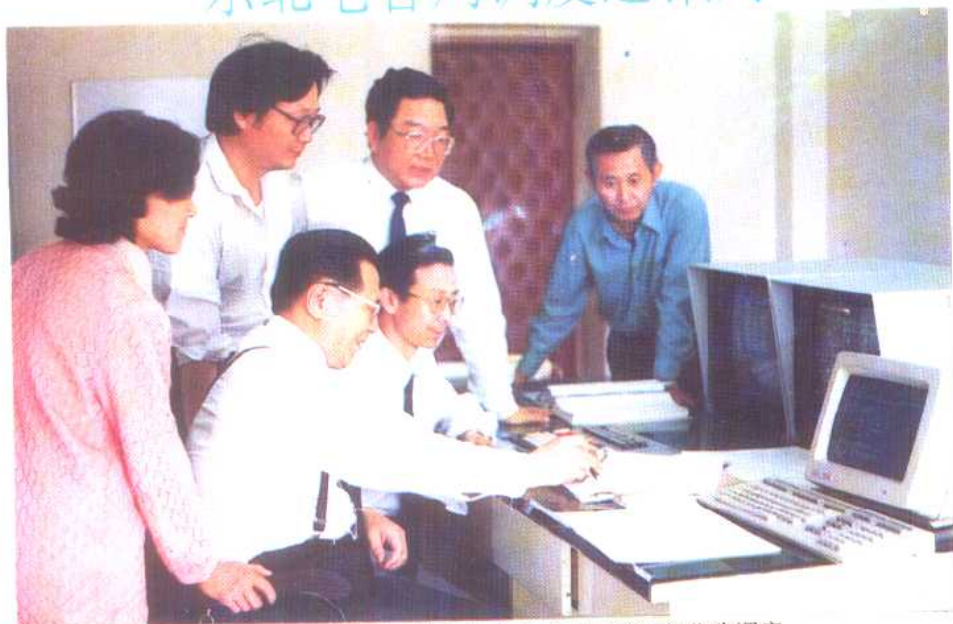
调度通讯局的有关同志正在研究发电负荷“等微增”优化调度