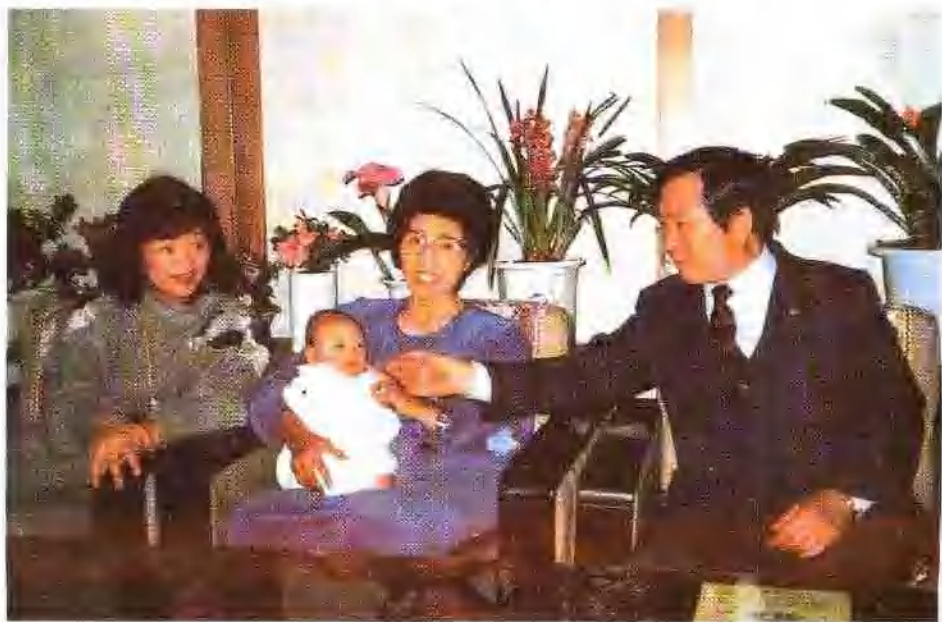
金大中夫妇与长孙金钟大及儿媳申善燕合影。1987年，汉城。