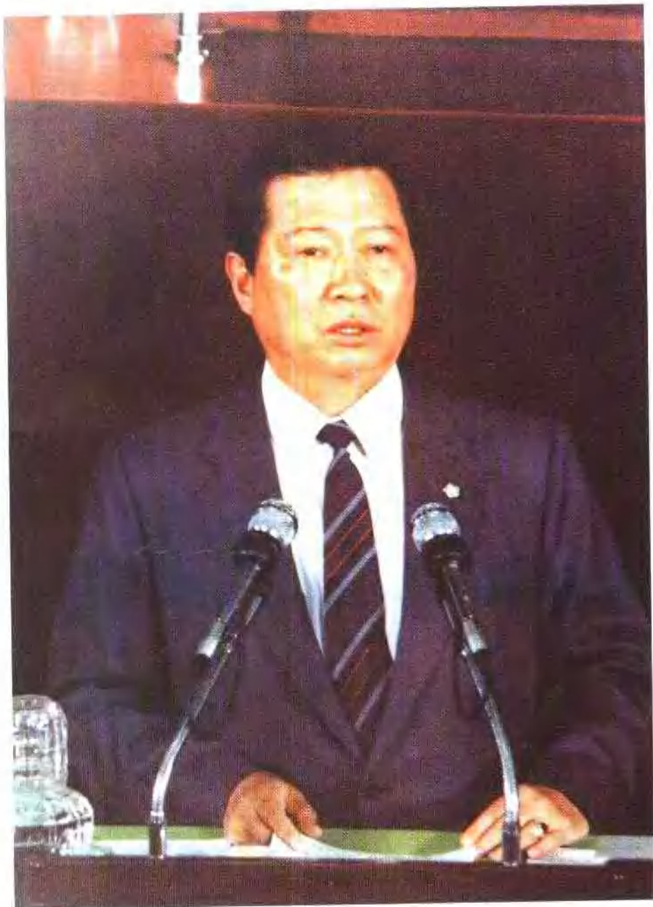
金大中在国会发表演说。由于政治迫害，这是他16年来争得的第一次言论自由。