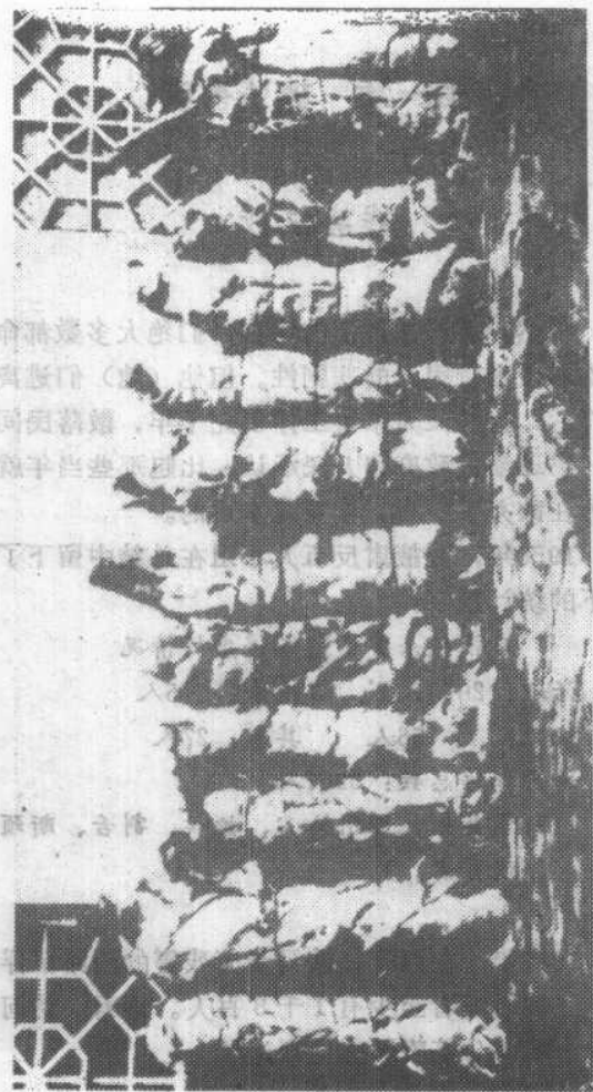
▲马匪将西路军战士残害后捆扎，准备运走邀功请赏。