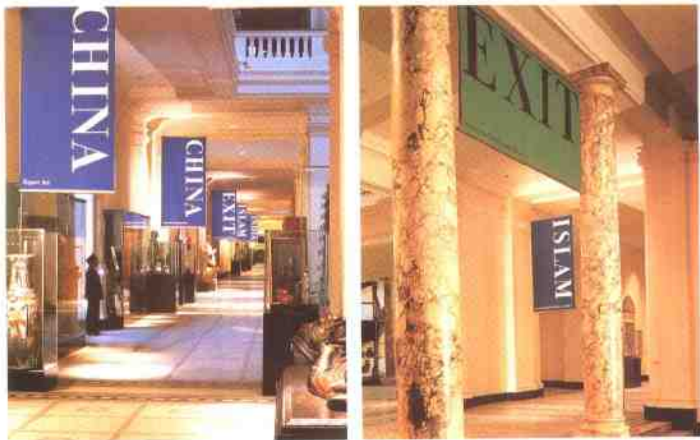
伦敦维多利亚和阿尔伯特博物馆 (V&A) 摄于1995 (左页)

位于伦敦的维多利亚和阿尔伯特博物馆 (VICTORIA & ALBERT MUSEUM) 是英国的一个历史悠久的博物馆，也是世界上最为著名的博物馆之一。作为一个知名的文化机构，它被先后有过许多的标志和符号。为了理清这种不统一的关系，该博物馆特别委托英国最重要的设计师大卫·莱斯特为其设计一个新的标志以取代所有其它的标志符号。在标准的设计要求上应包括“V & A”三个大写字母符号，功能性强，不受过、现在和未来时间的限制，数量有限，容易识别并且值得记忆。莱斯特在设计上选择了具有欧洲历史传统高尚、优雅韵味的波多尼字体。这种字体最初是约两百多年以前的南意大利佛罗伦萨-波多尼 (GIAMBATTISTA BODONI) 在意大利北部的巴马镇设计而成。莱斯特“V”的右边部分和“A”的左边部分巧妙地有机地联系在一起，使整个新的标志设计既高雅别致，又巧妙自然，且不失易识别、易记忆的特点。在形式上，各个字母的体量大小、字间距和粗细、高低和方圆等相应部分也都体现出一种优雅和协调。