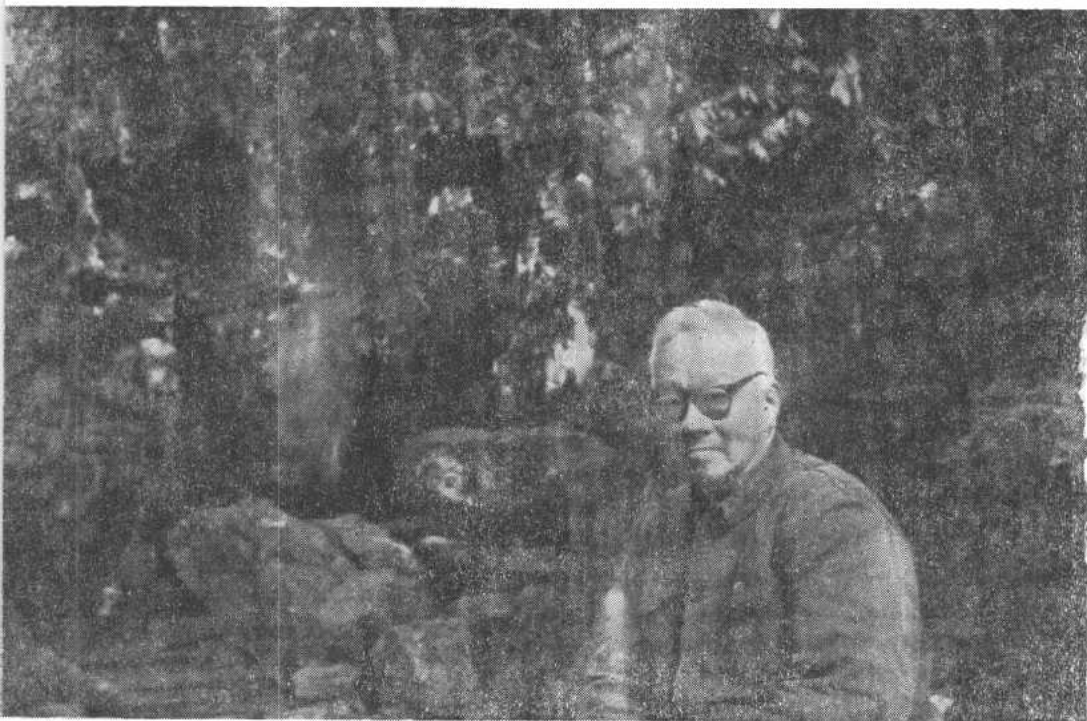
宗白华在灵隐寺留影