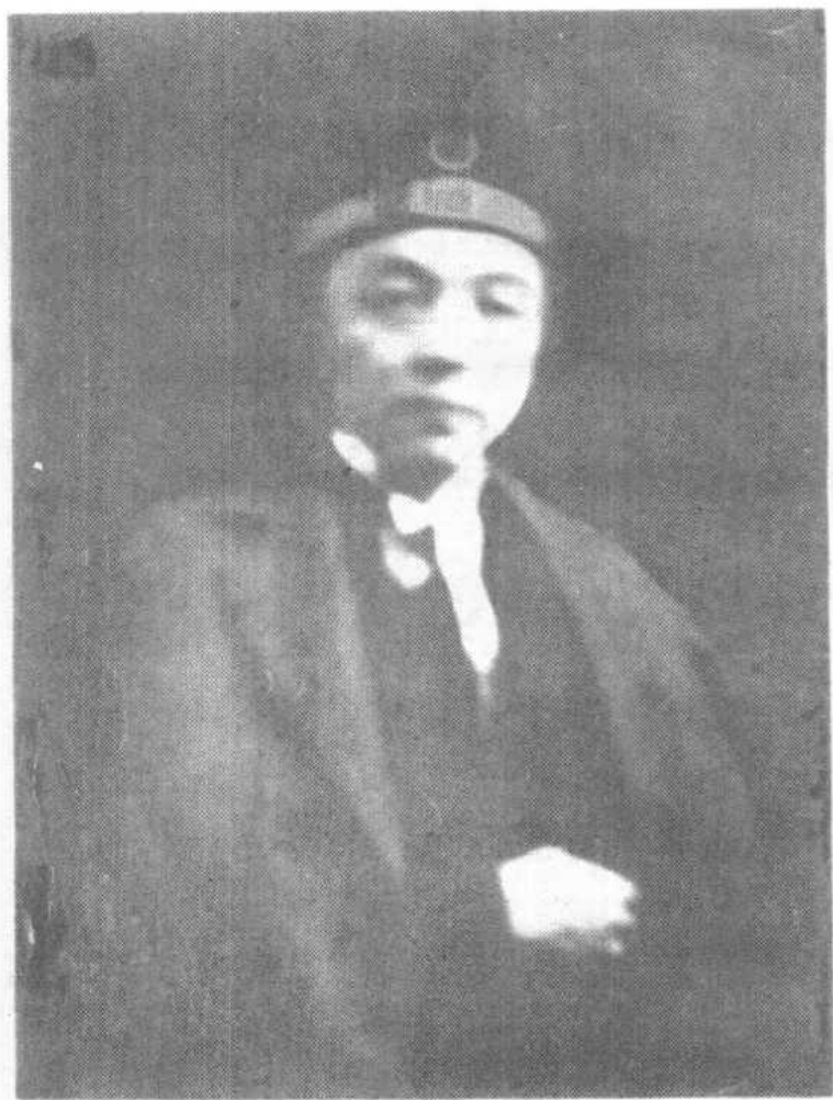
民國十四年牛農在 巴黎大學作學生時