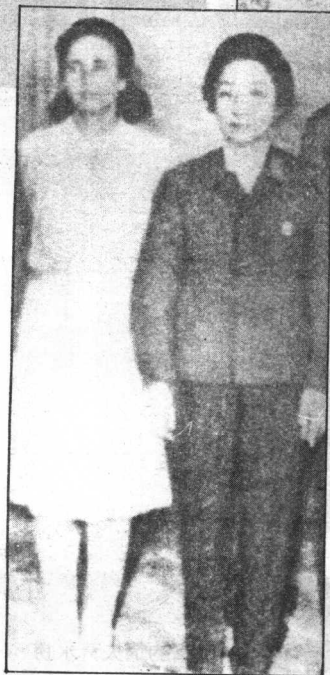
◀一九七一年六月，葉羣與羅馬尼亞總統齊奧塞斯庫夫人在北京合影。