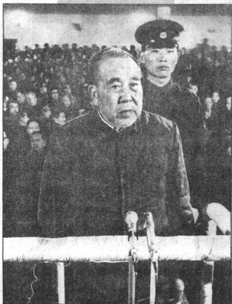
◀葉羣的情夫黃永勝。