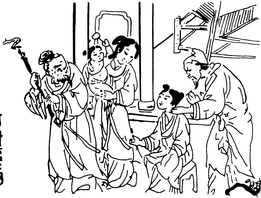
图2 耳穴按摩治疗图