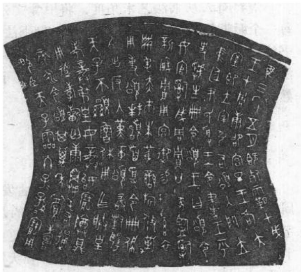
图 2 西周《颂鼎》铭文

金文字体比甲骨文更为方正整齐，结体虽然存在一定的随意性，但绝大多数数字的结体，仍有规则可寻。由于它先刻在软坯上然后浇铸，所以笔画转折处，