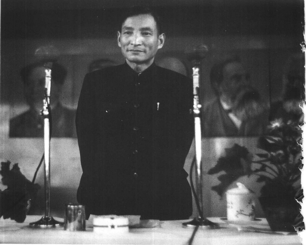
6、新中国成立初期的陈云。