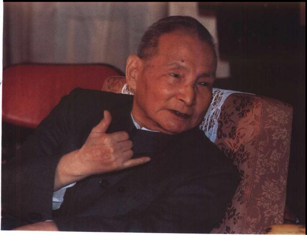
2、1984年12月24日，陈云在谈话。