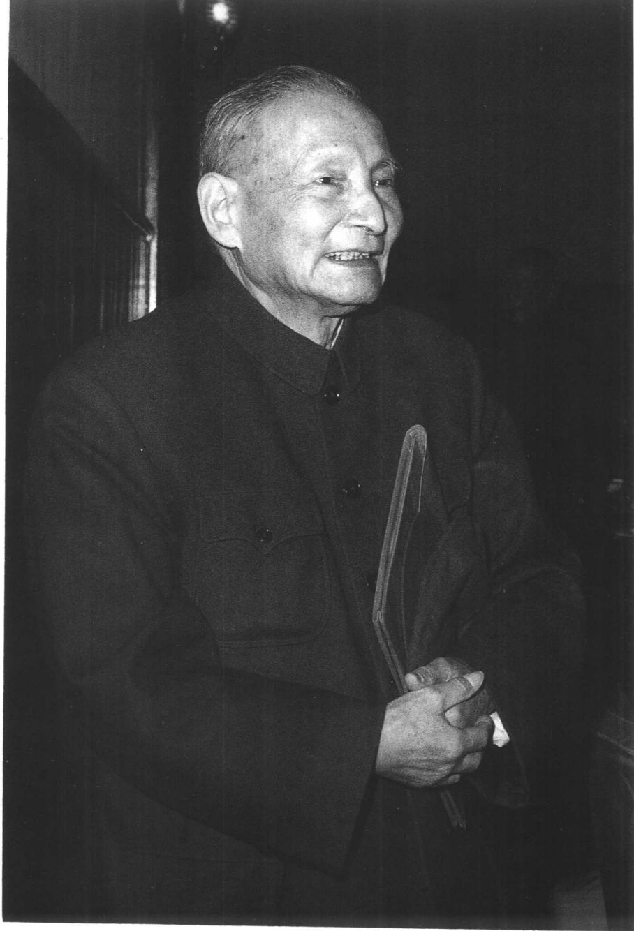
10. 1980年2月24日, 陈云在中共十一届五中全会上。