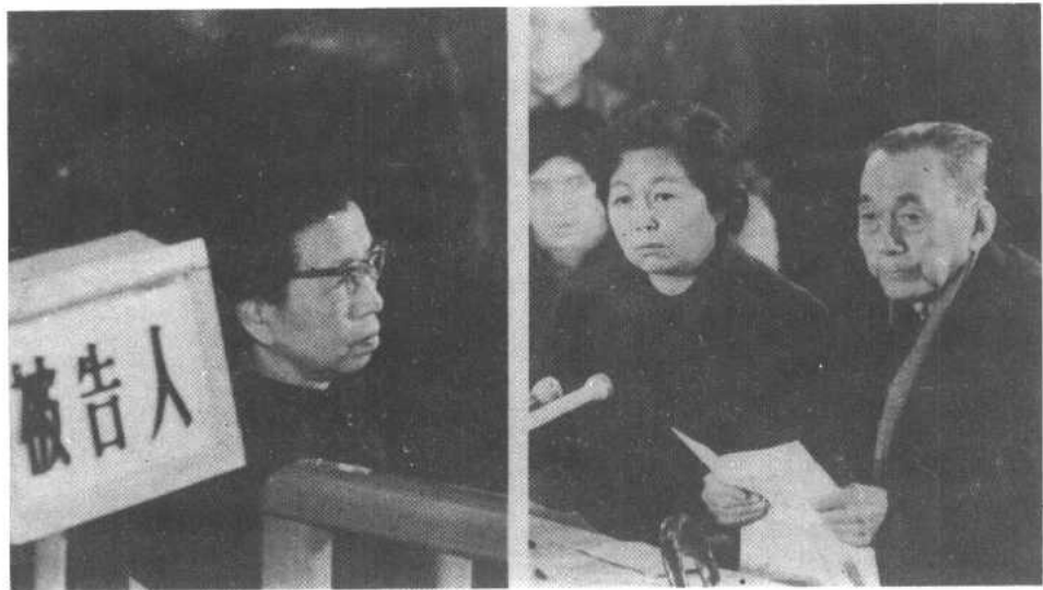
1980年12月，王昆仑（右图右一）在审判“四人帮”的特别法庭上，控诉江青（左图）迫害民主党派成员的罪行