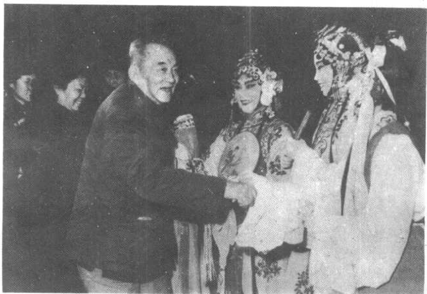
1978年冬，会见北京昆曲剧院演员