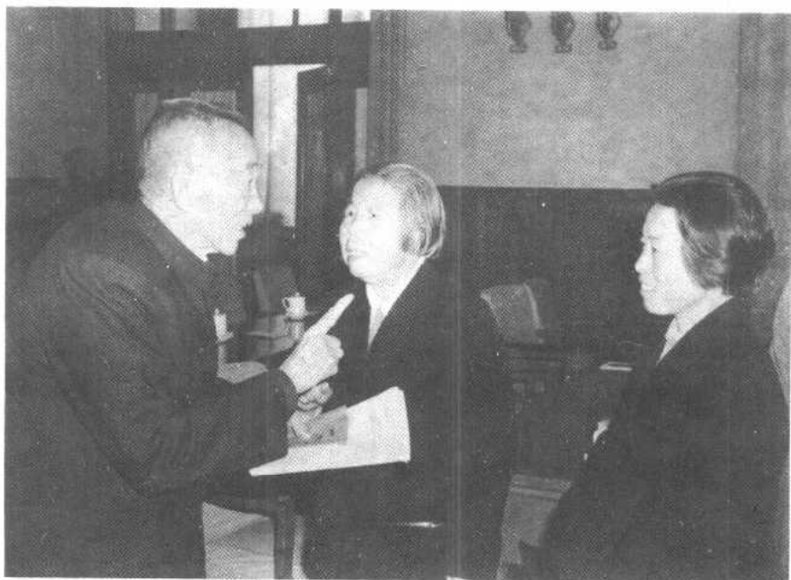
1980年4月，在五届全国政协第14次常委会上，与邓颖超（中）交谈