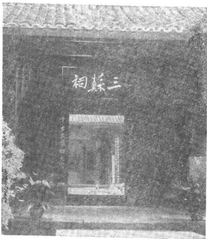
二、四川眉山縣三蘇祠