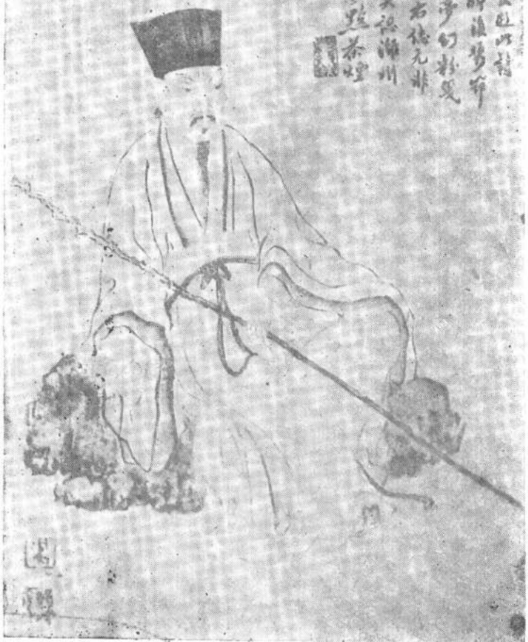
一、蘇軾畫像 傳宋李公麟原畫