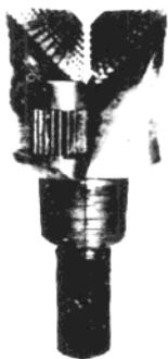
图 1-1 最早的牙轮钻头