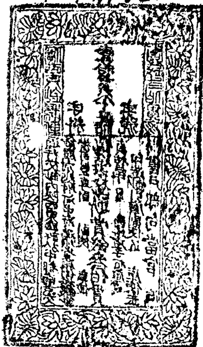
金陵西路壹拾貫交鈔版 205×116