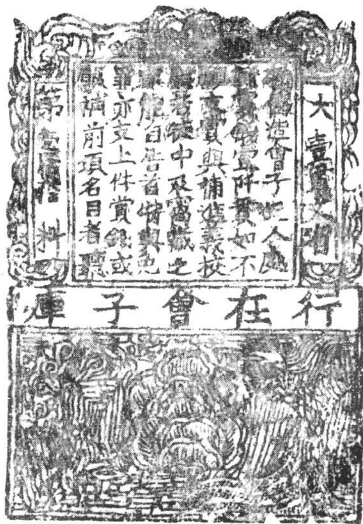
南宋行在會子庫版 185×124