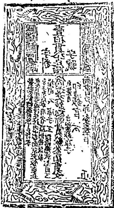
金北京路壹佰貫交鈔版