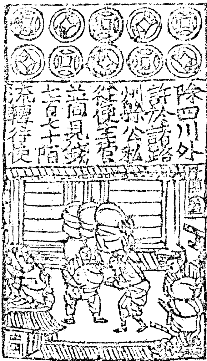
北宋纸币版 171×95 这是至今所见最早的纸币版实物