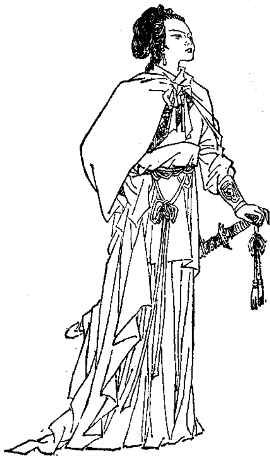
邓 威 娘