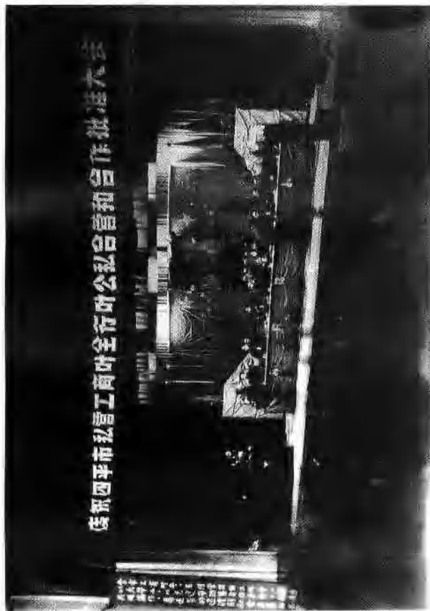
1956年1月四平市举行私营工商行业公私合营和合作批准大会，宣布全市私营工商行业全部实现公私合营和合作化。