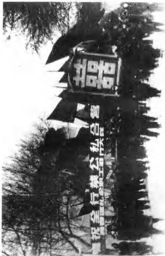
1956年1月长春市私营工商业者和广大职工举行盛大游行和报喜活动,欢庆全市资本主义工商业实现全行业公私合营和合作化。