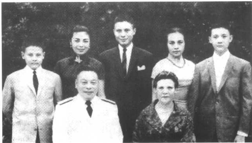
蒋经国夫妇与子女。