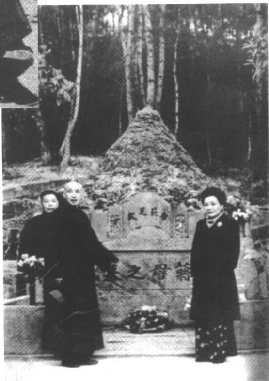
蒋介石与 宋美龄拜谒其 母墓。