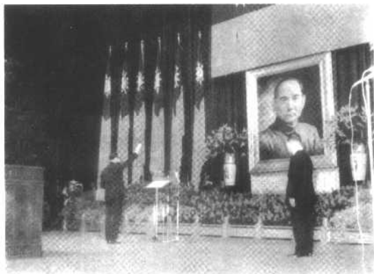
1978年5月20日， 蒋经国宣誓就任 “中华民国总统”。