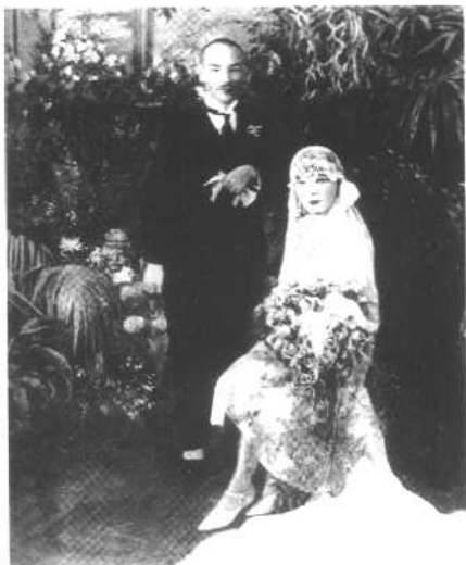
1927年12月1日，蒋介石与宋美龄在上海结婚。