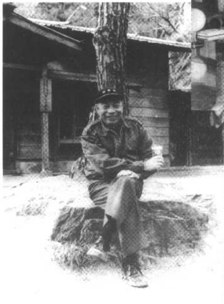
1966年1月，蒋经国在北横公路旁留影。