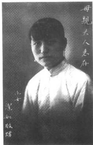
蒋介石前妻陈洁如。