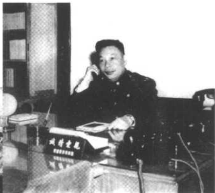
蒋经国于办公室留影。