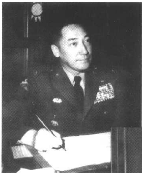
1964年，湖口事件后的 蒋纬国。