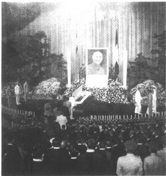
蒋介石纪念馆内景。