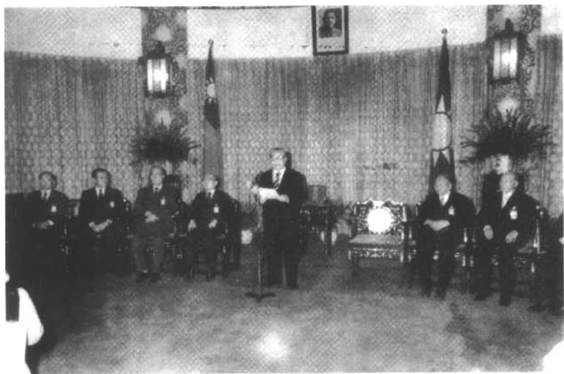
蒋经国接受国民党主席当选证书后讲话时的情景。