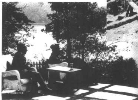
蒋介石与蒋经国在台湾日月潭。