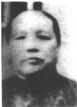
蒋介石原配妻子毛福梅。