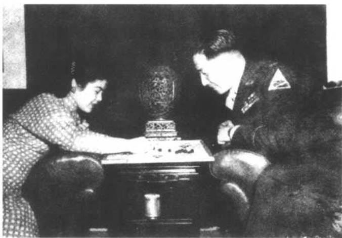
蒋纬国与前妻石静宜在一起。