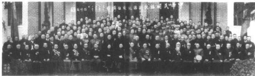
1948年5月20日，蒋介石、李宗仁就任正副总统宣誓就职后留影。