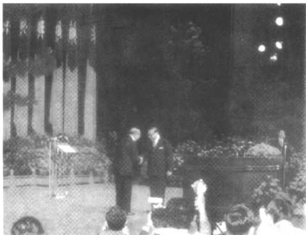
蒋经国接受卸任“总统”严家淦的祝贺。