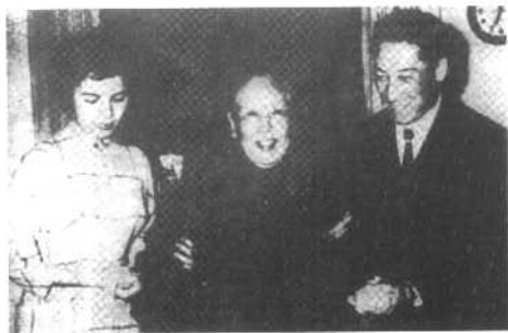
蒋介石侧室姚冶诚在蒋纬国与邱爱伦的婚礼上。