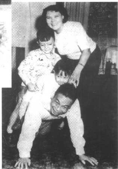
1950年10月2日，蒋经国夫妇与子女在长安东路寓所。