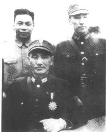
蒋介石与蒋经国、蒋纬国。