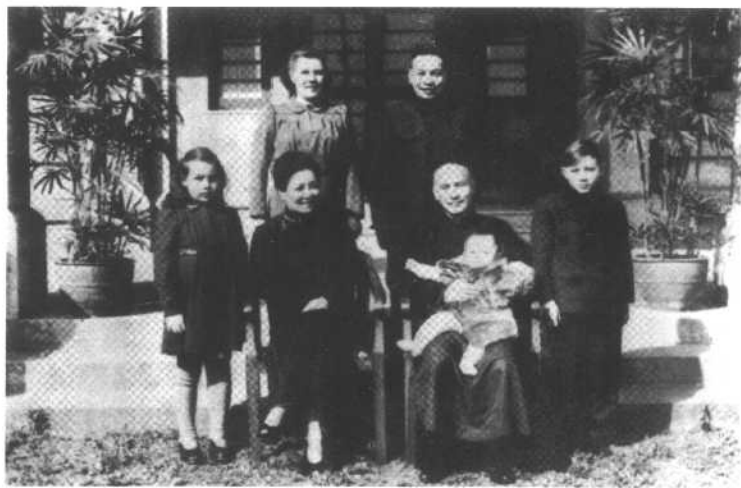
蒋介石夫妇与蒋经国夫妇等。