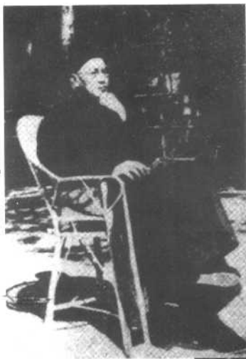
1949年初，第三次下野的 蒋介石在故乡溪口。