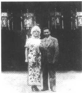
蒋经国夫妇自苏联返 国后，补办婚礼时的留影。