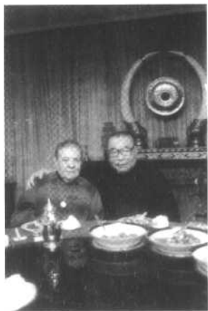
1985年3月，蒋经 国与夫人欢度金婚。