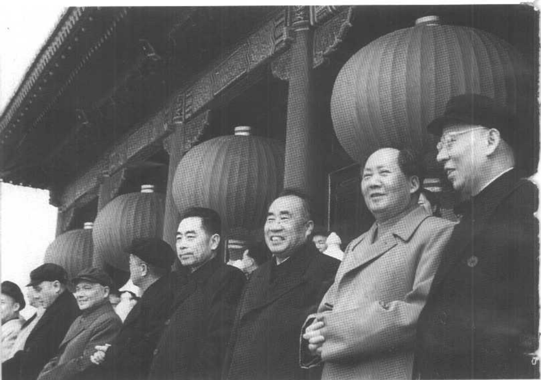
1956年五一国际劳动节，在天安门城楼上。