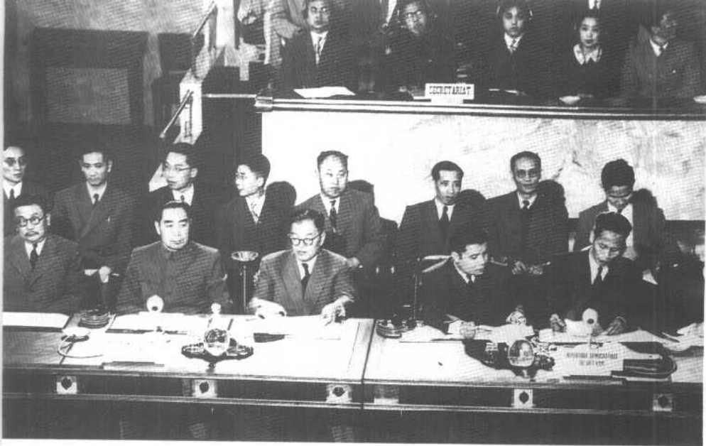
1954年，在日内瓦会议上。

1956年5月，在招待出席全国长期科学规划会议代表的酒会上同李富春、聂荣臻、郭沫若和科学家们交谈。