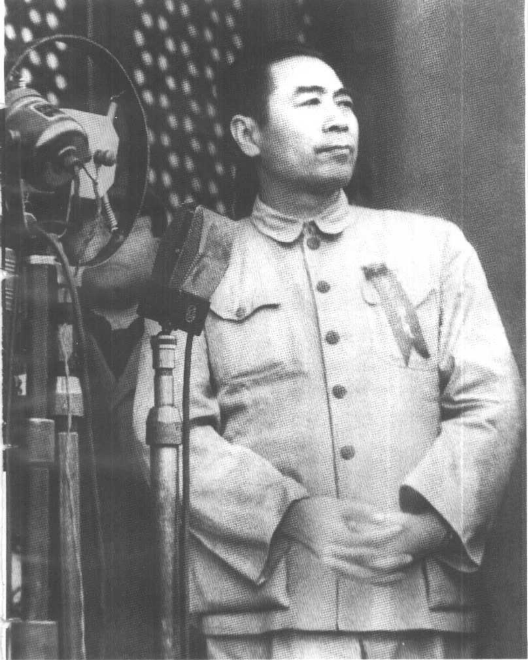
1949年10月1日，在天安门城楼上。