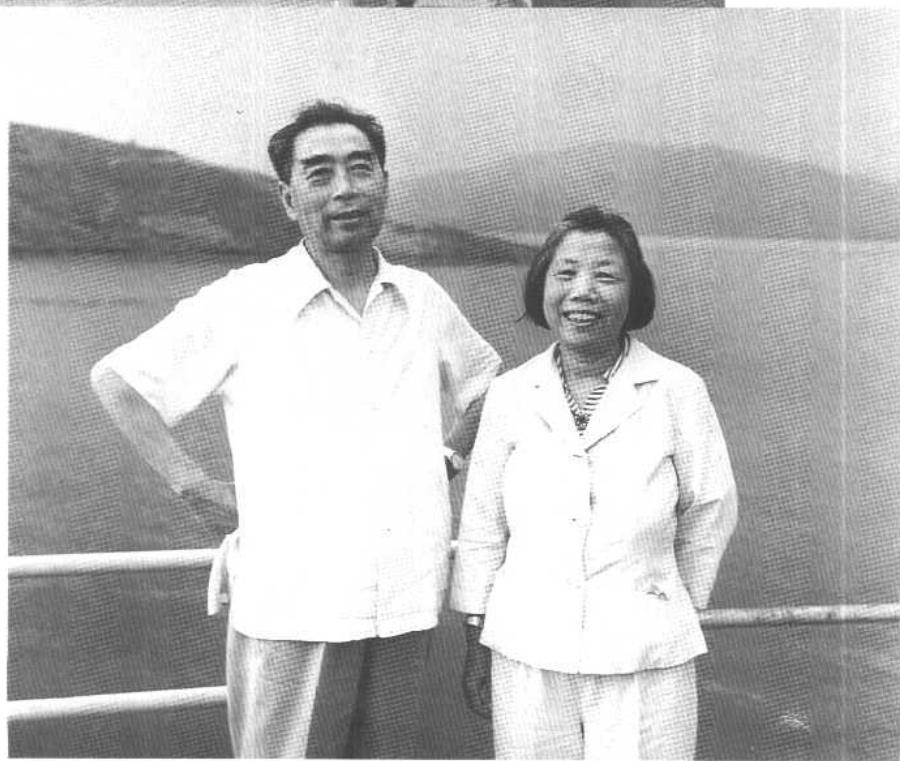
1960年8月30日，和邓颖超在密云水库。