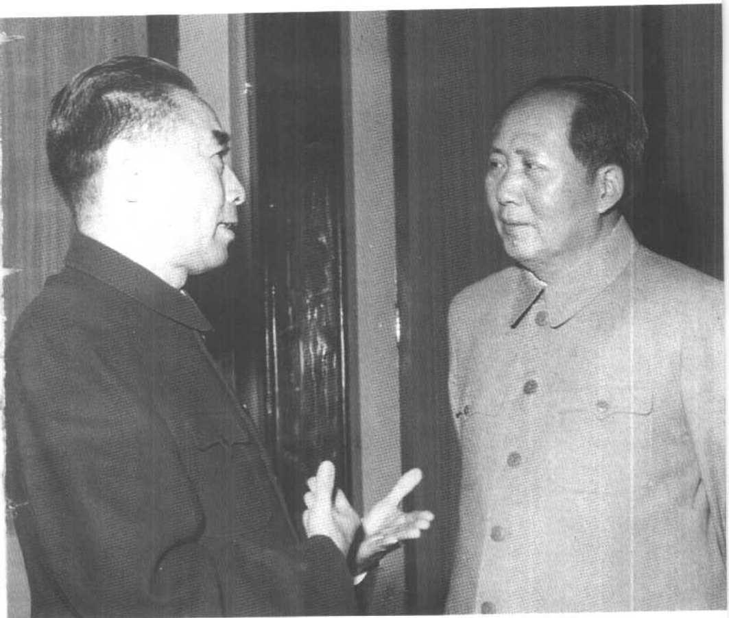
1963年，和毛泽东在一起。