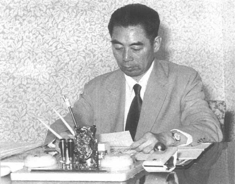
1955年， 万隆会议期间 在住地办公。