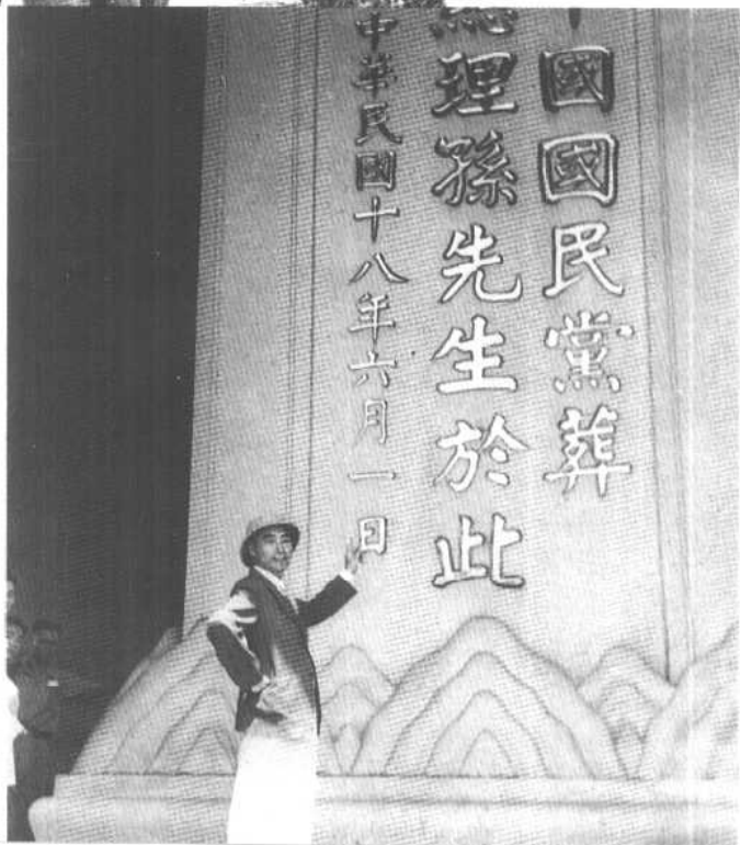
1946年秋， 在南京中山陵。