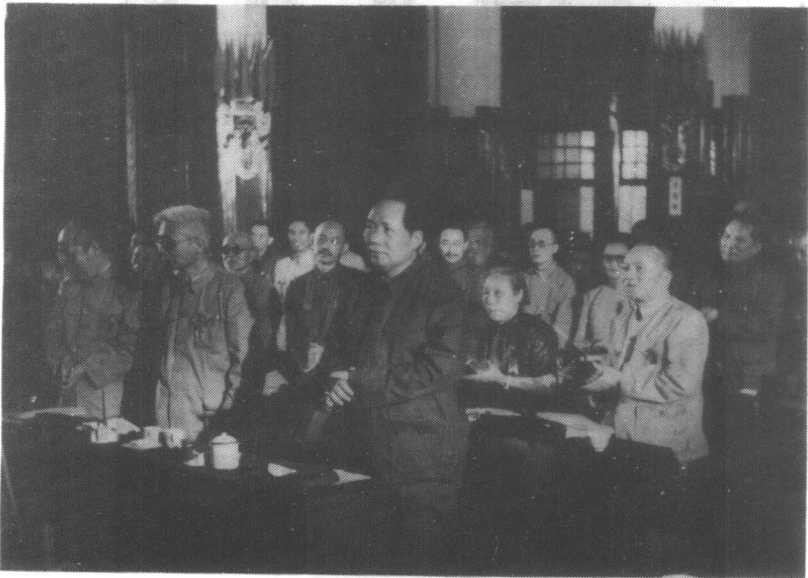
• 通过政协组织条例