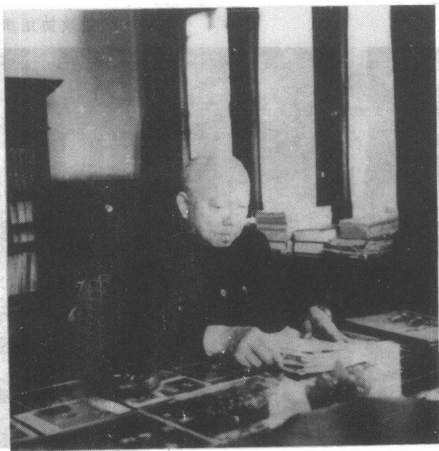
• 在书房工作（一九五九年北京东单）