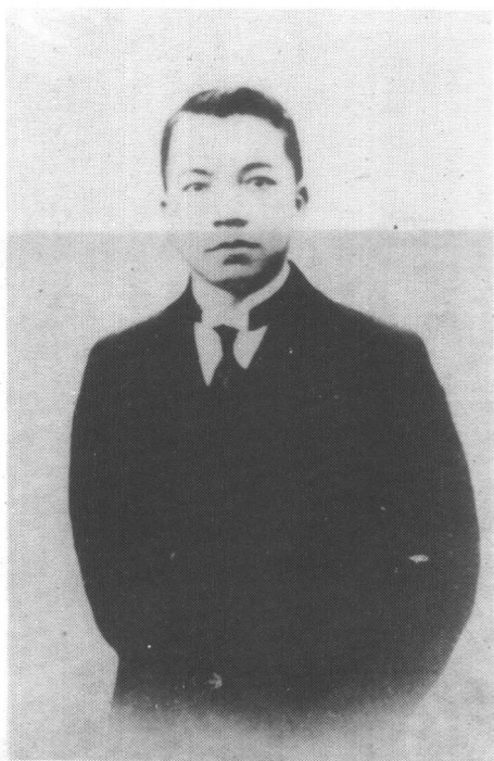
• 青年时期的李济深