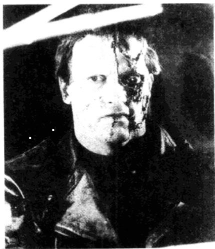
在电影《终结者》中，阿诺德·施瓦辛格成功地塑造了一个恶贯满盈的恶棍形象。