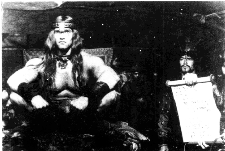
阿诺德·施瓦辛格在电影《摧毁者康南》中扮演与野蛮人康南宣战时的不屑一顾。