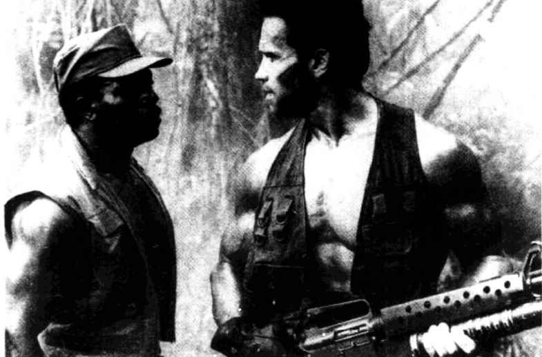
阿诺德·施瓦辛格在电影《食肉动物》中的表现。