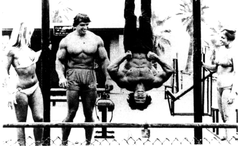
阿诺德·施瓦辛格拍摄电影《举重》时，与拍档一起在外景地小憩。