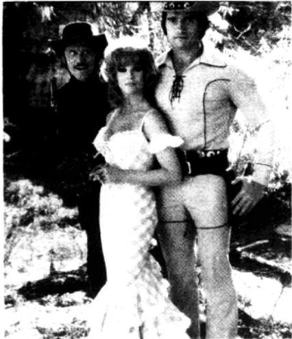
阿诺德·施瓦辛格在电影《骗子》中扮演命运不济的骗子。