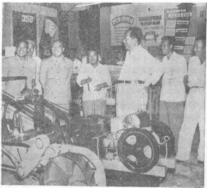
毛主席參觀天津市工業技術革命展覽會。左起第一人是中共河北省委書記、河北省省長劉子厚，第二人是中共天津市委書記、天津市市長李耕濤

矽膠成功的工人時，親切地同他握手。主席伏在展覽台前，仔細地看了各國的矽膠樣品和質量比較表。英國的矽膠吸酸能力只有29%，日本的矽膠吸酸能力是46%，而我國自制的矽膠吸酸能力達到61%。主席贊揚地說好。