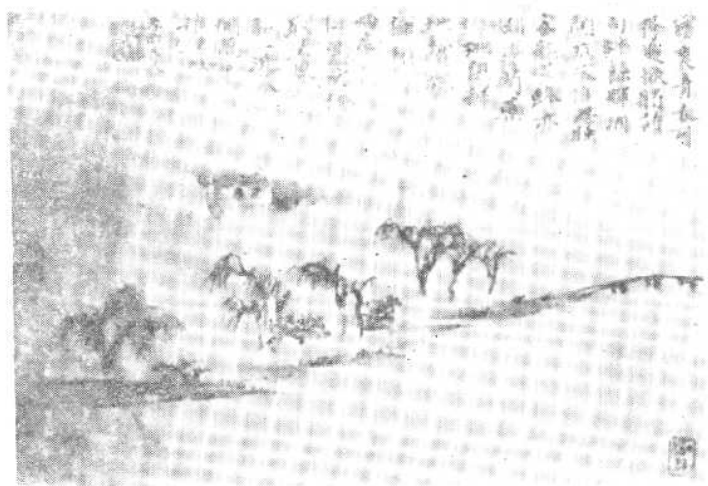
石涛画苏轼《送春》诗意