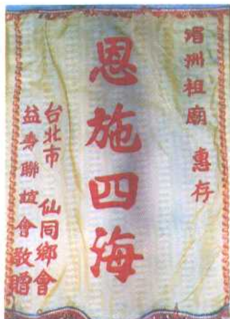
台胞赠送湄洲岛妈祖庙锦旗