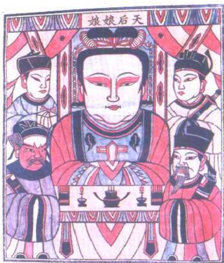
天后娘娘 (河南朱仙镇版画)