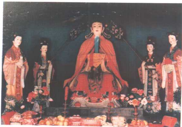
天后圣母像 (天津天后宫)