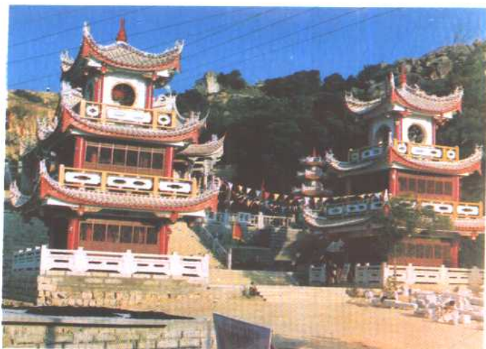
福建莆田湄州岛祖庙梳妆楼