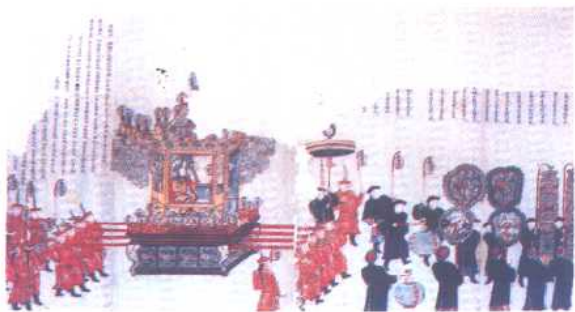
妈祖出巡(天津天后宫) (中国历史博物馆藏)