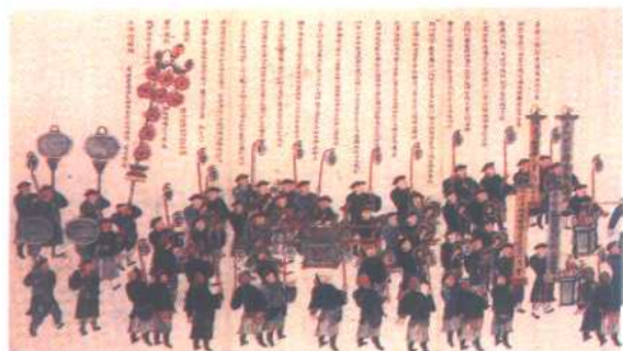
河东善音法鼓老会(天津天后宫) (中国历史博物馆藏)