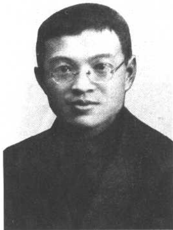
1927年在莫斯科学习期间的张闻天。