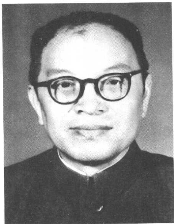
张 闻 天