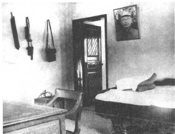
1935年1月张闻天 出席遵义会议时的住室。