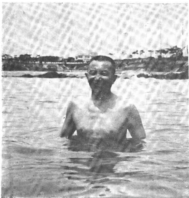
游泳是将军最喜爱的一种运动。