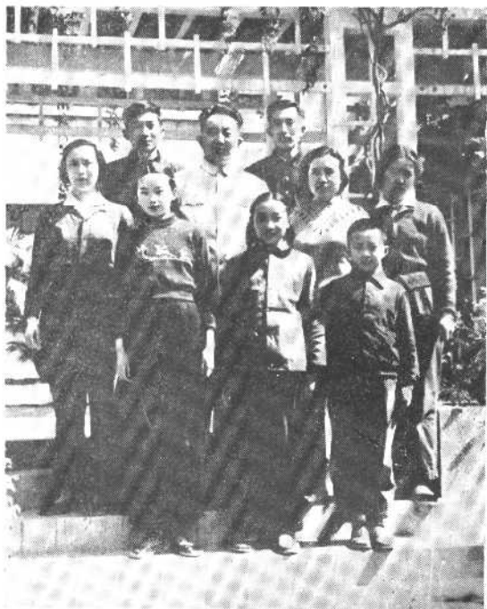
1962年春节，全家在广州留园。