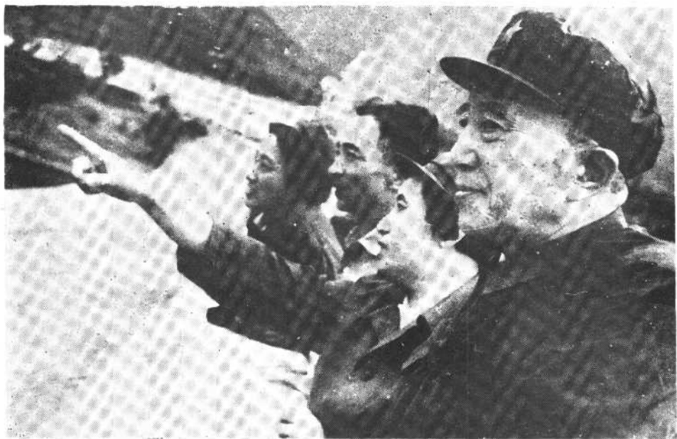
1975年10月1日，与夫人、子女在十三陵水库。