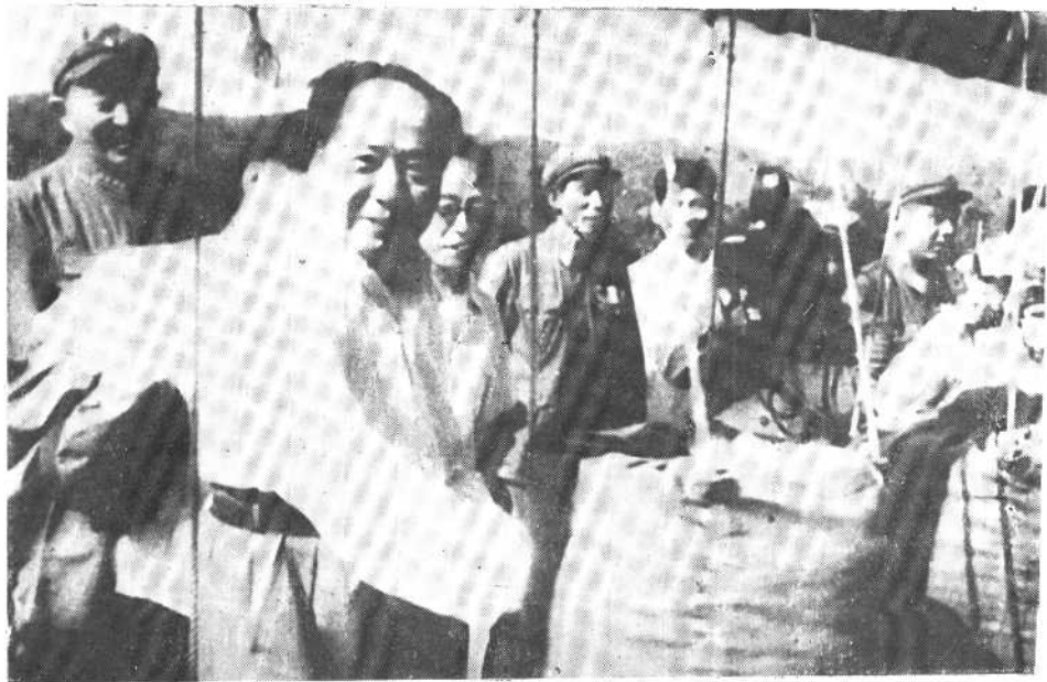
1964年，陪同主席检阅部队训练。毛主席对着画有蒋介石头像的沙袋说：“老朋友，久违了，我也打你几拳。”