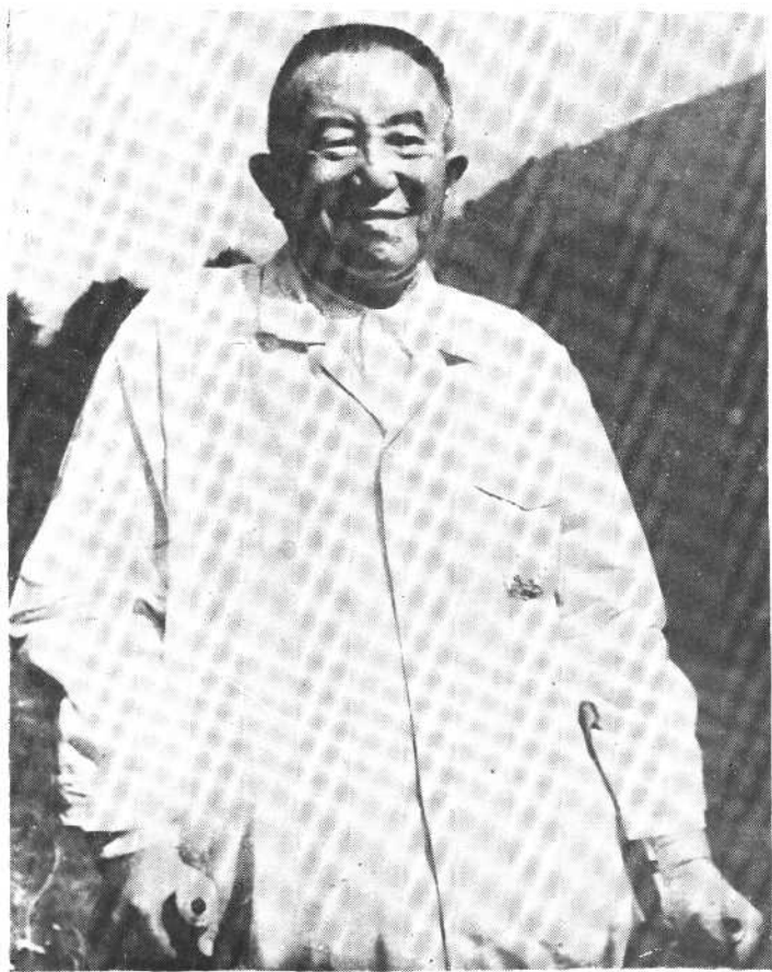
1978年7月31日下午,在海德堡医院。