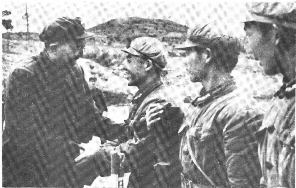
1964年2月11日，在广州上元岗看47军迫击炮班的教学表演后，与班长谈话。