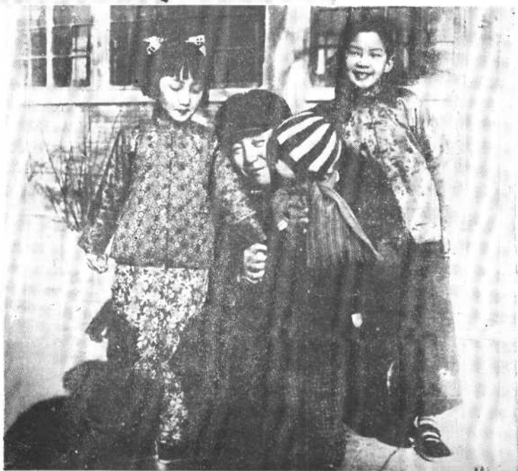
1957年， 与女儿朵朵、 点点、儿子了 了在北京家 中。