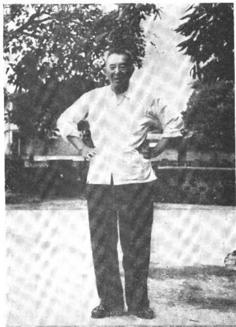
一九七四年，在福州治腿伤，经艰苦练走，将军终于丢开双拐，高兴地说：“我站起来了。”