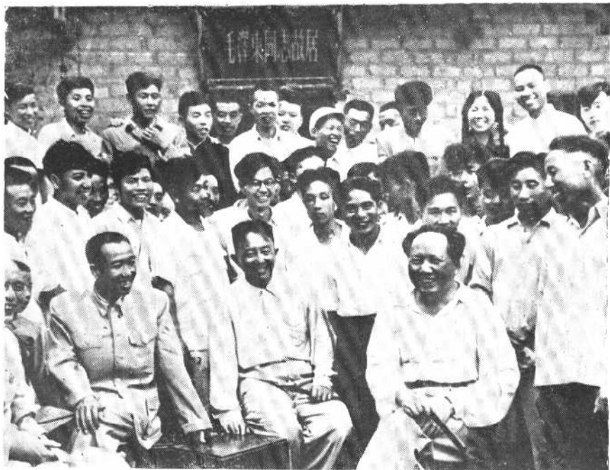
1959年6月，随毛主席回韶山。