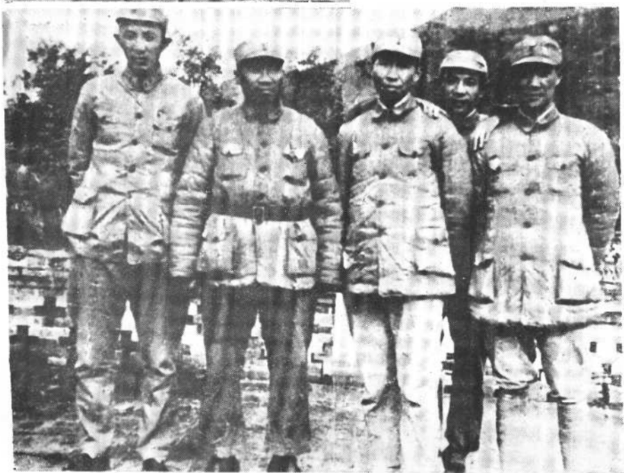
1936年，东渡黄河前后，与朱总司令、郭述申、许建国同志等合影。