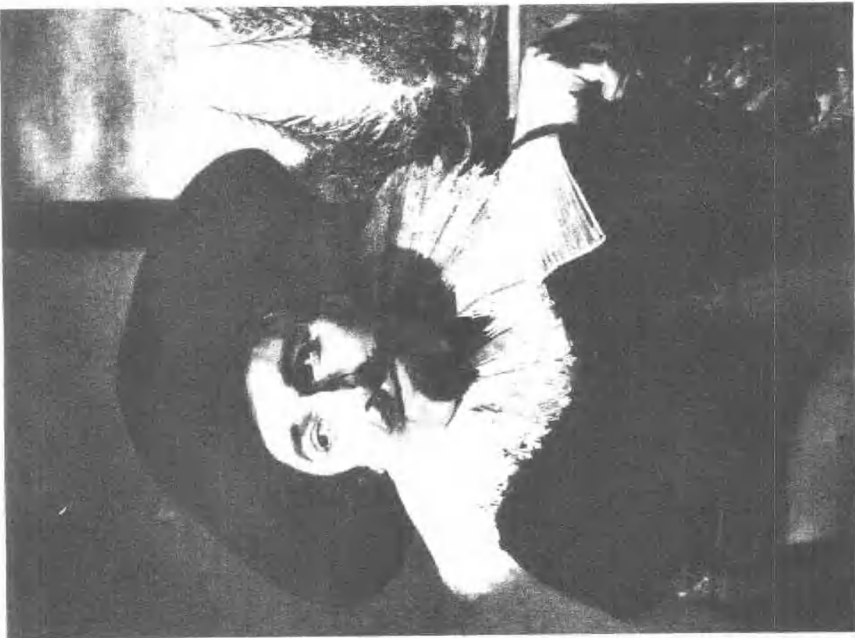
11 依·亚·马沙 (1626)