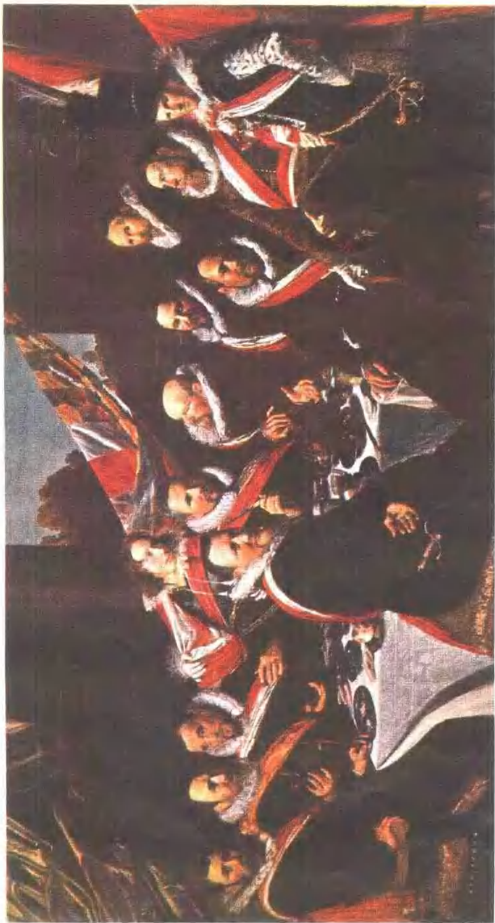
16 圣乔治射击连军官们的宴会 (1626)