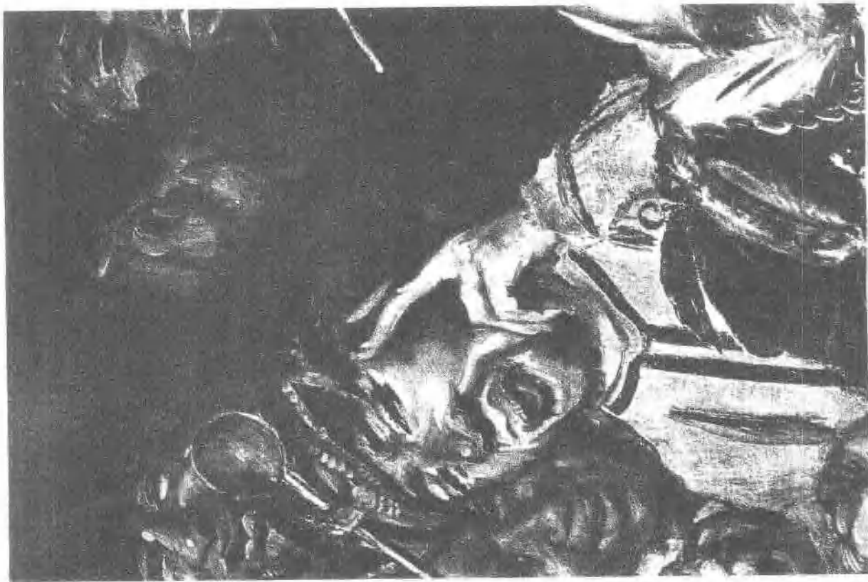
4 爽朗的伙伴 (局部, 约1616)