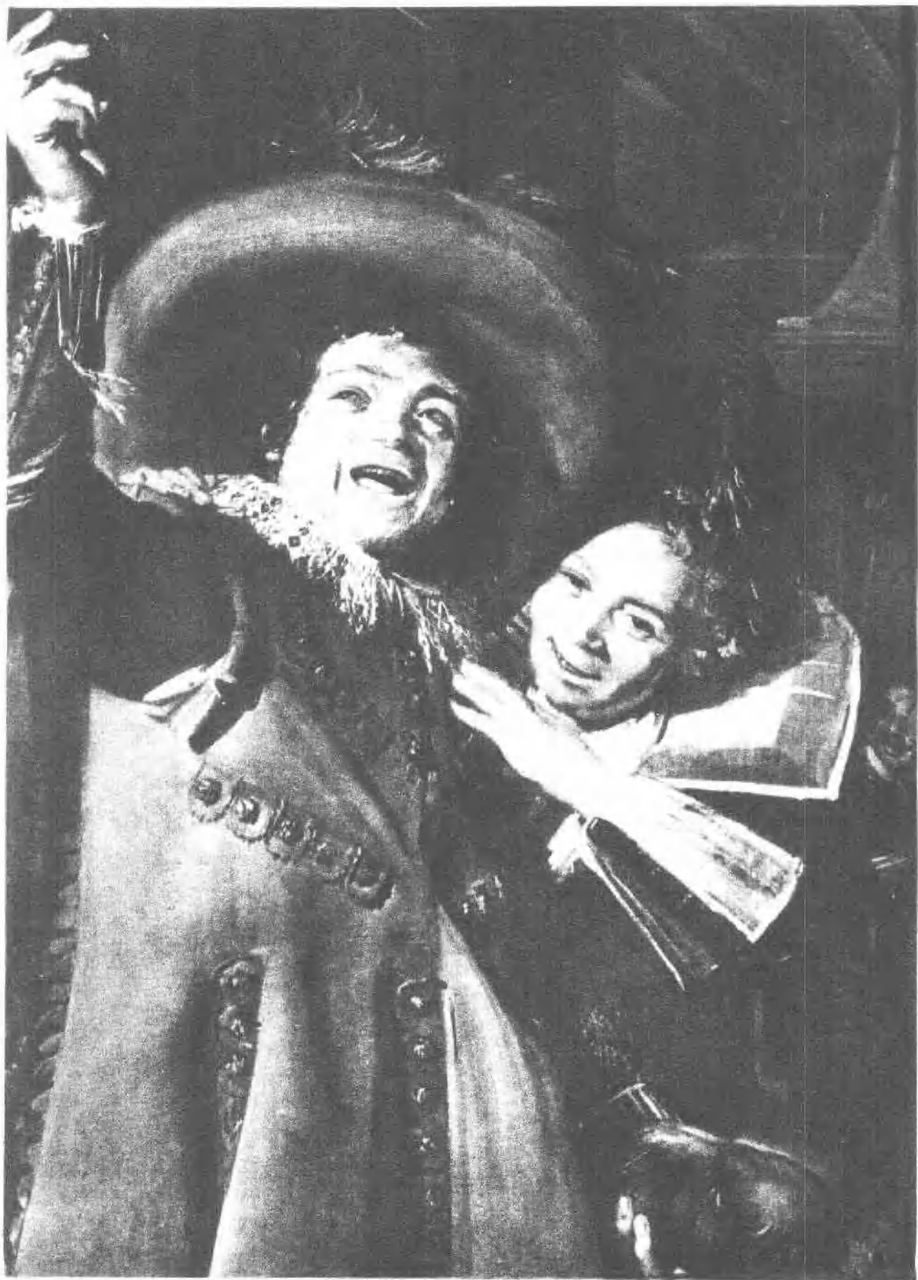
2 荣克尔·兰普及其情人 (局部, 1623)