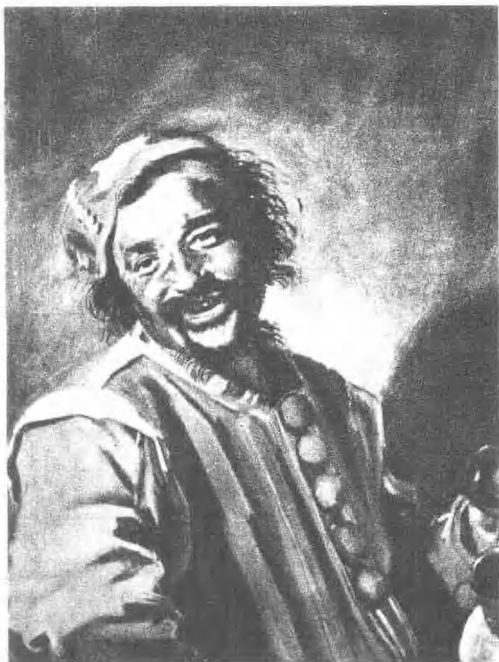
13 佩克哈林像 (1628-30)