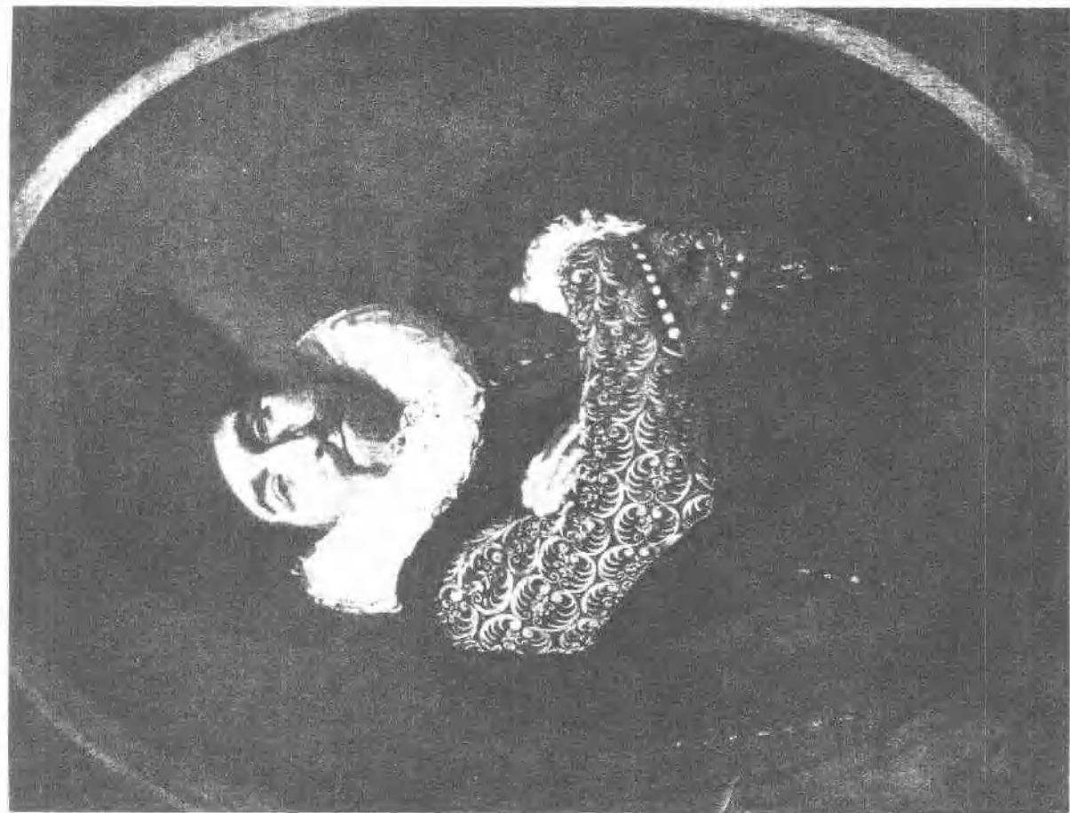
6 男像 (约1622)