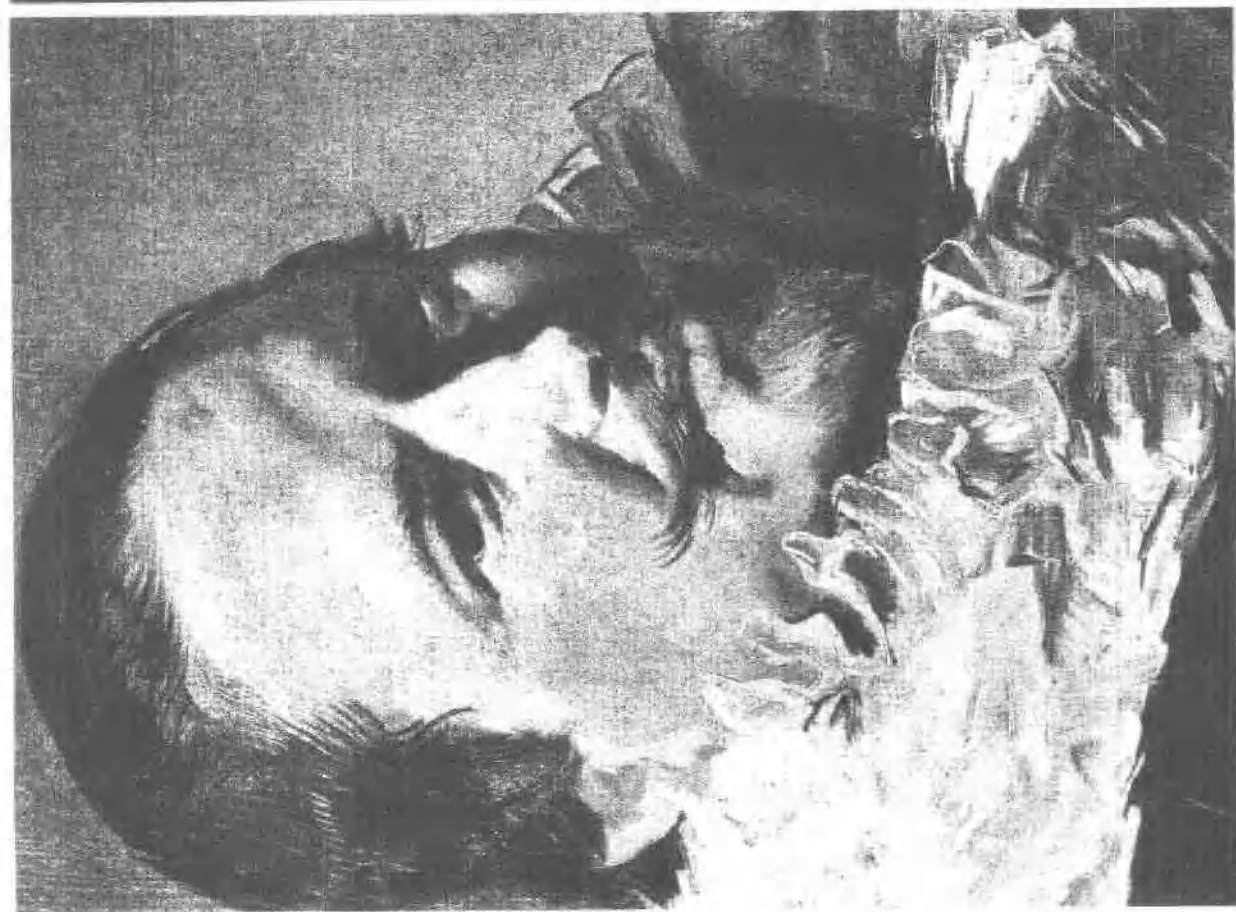
10 男像 (1633)