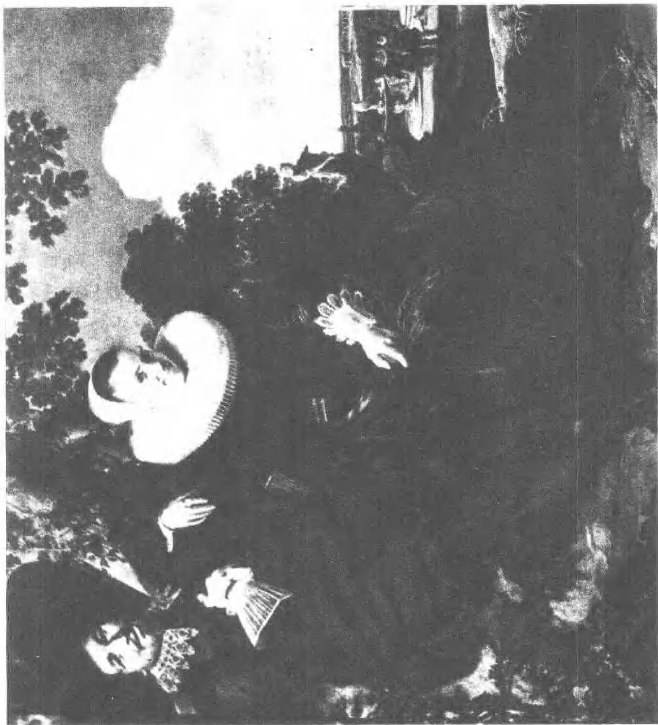
12 新婦夫婦像 (約一六三)