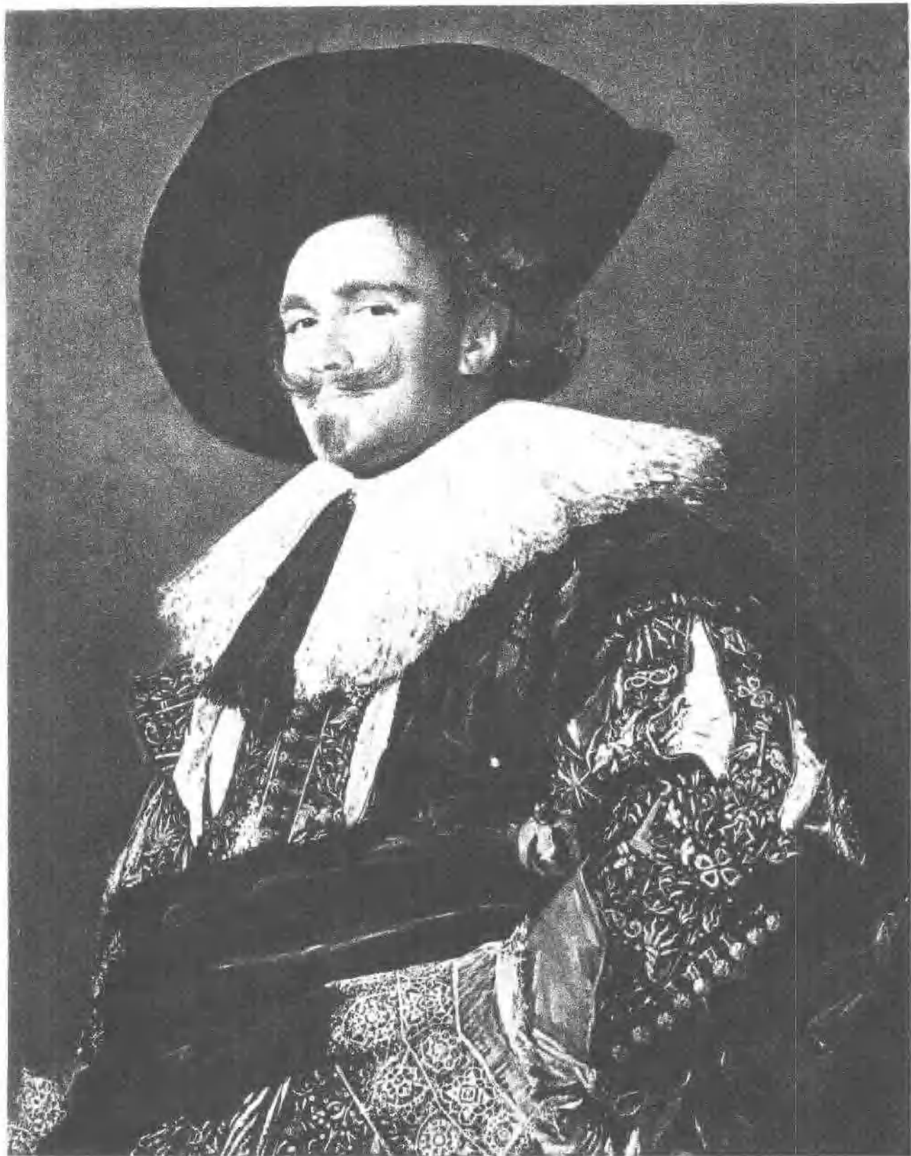
9 笑脸军官 (1624)