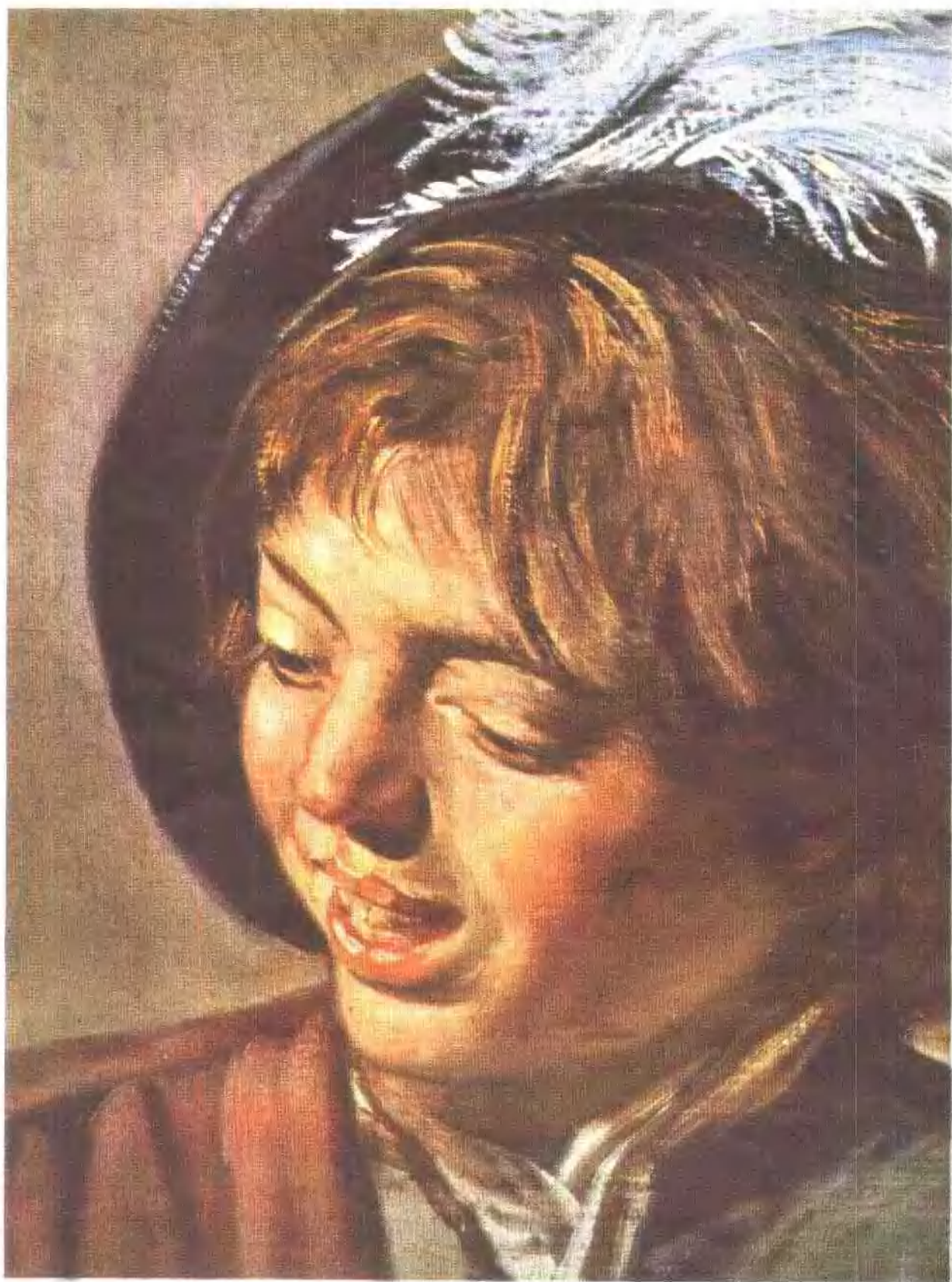
18 吹笛的男孩 局部 · 1625-271