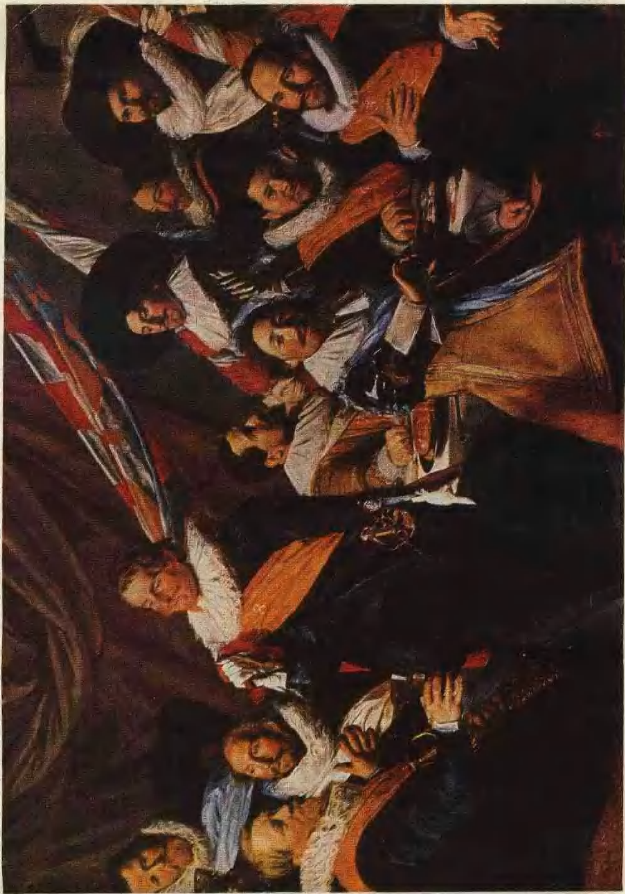
17 圣乔治射击连军官们的宴会 (1627)