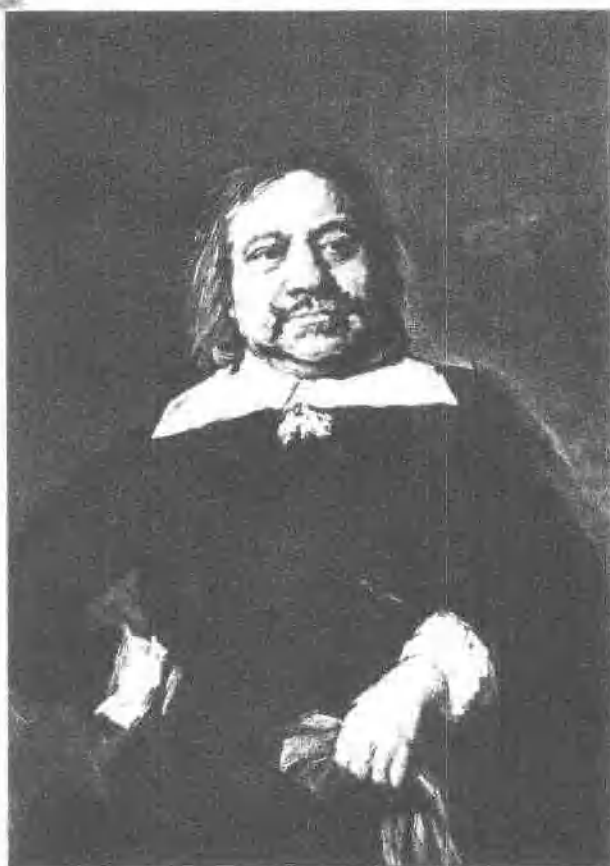
14 威廉·克路斯 (约1655)