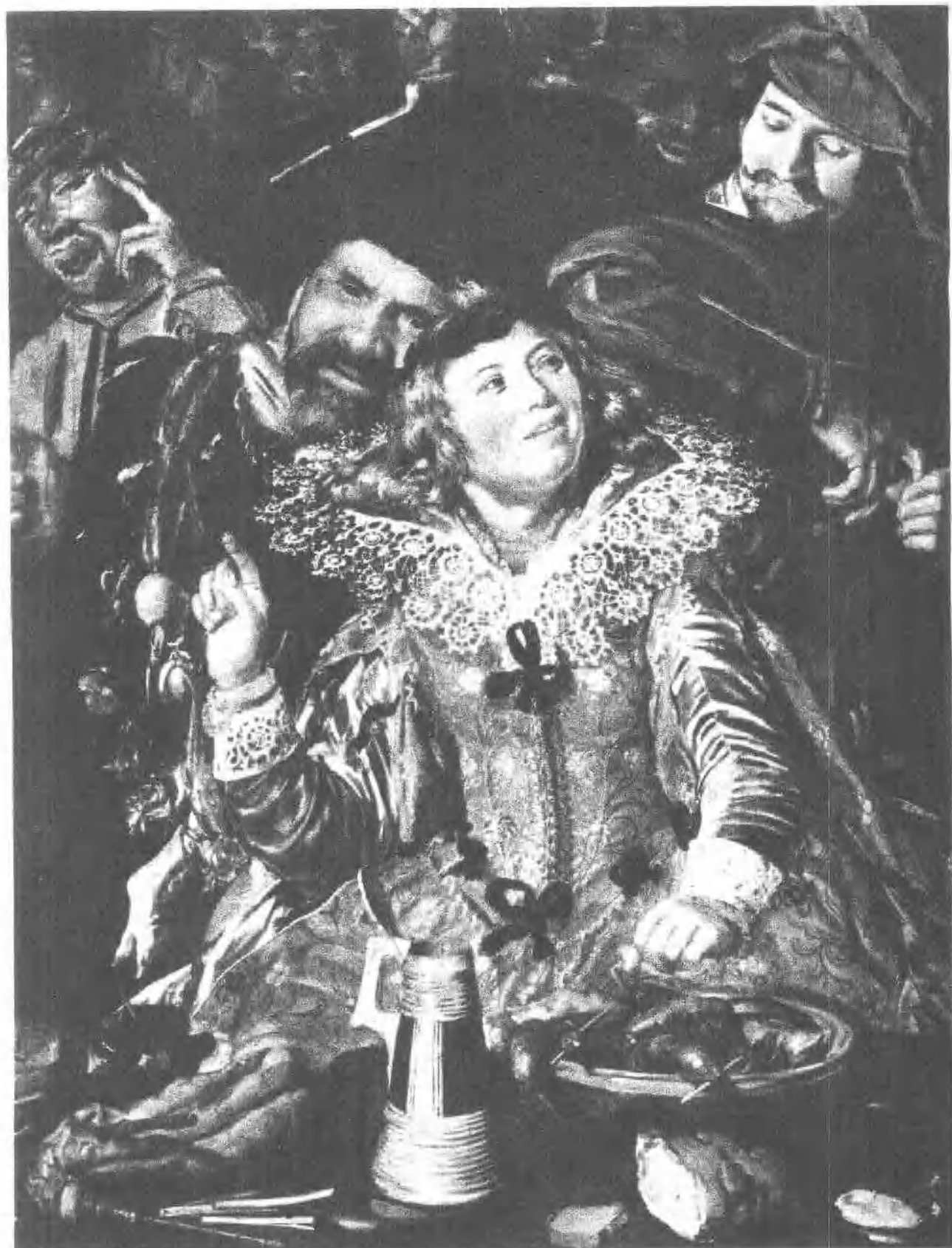
1 爽朗的伙伴 (局部, 约1616)