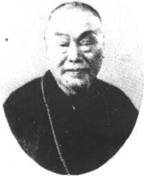
歲 二 七