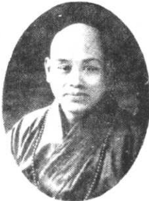
歲 五 三