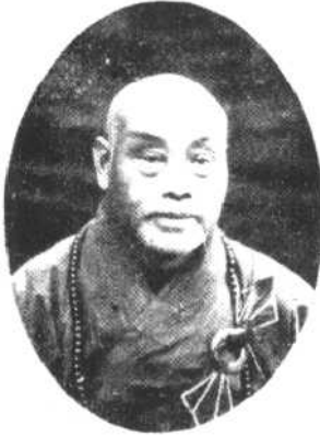
歲 十 六