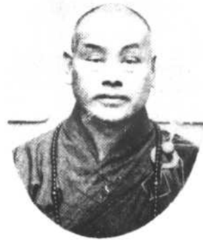
歲 八 五