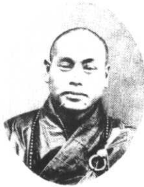
歲 十 五