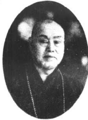
歲 五 六