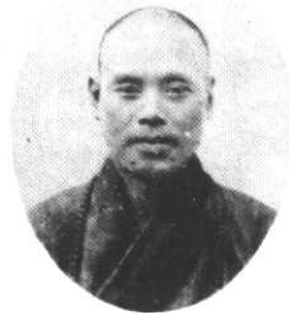
歲 五 四