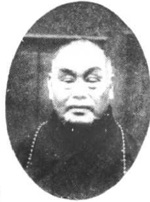
歲 十 七