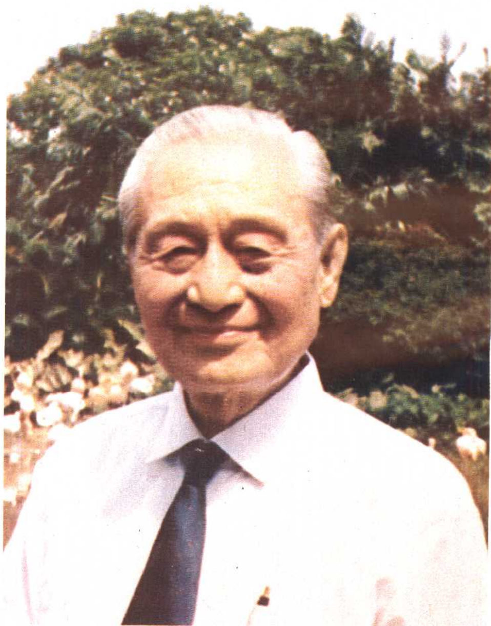
士居初樸趙長會會協教佛國中 三有十八年是