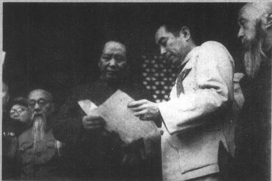
开国大典时,和毛泽东等在天安门城楼上