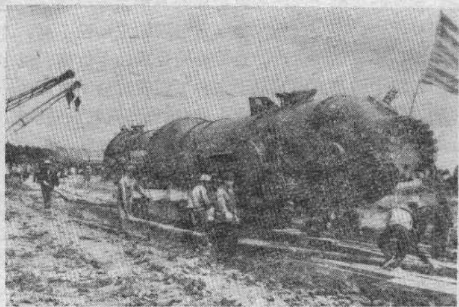
大庆工人把几百吨重的大型设备，用人拉手推的办法运到现场