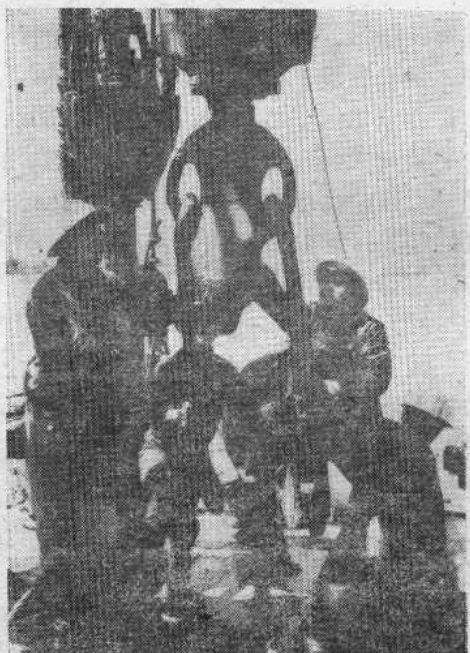
大庆“铁人”王进喜同志和钻井队的工人们一起奋战