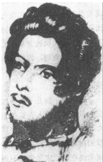
1836年波恩的大学生卡尔·马克思

马克思听从父亲的劝告，最后只选了六门课，到了第二学期甚至只选了四门。大学生的生活很快把他完全吸引住了。他成了特利尔学生同乡会的会员。大学生们在同乡会里有时饮得