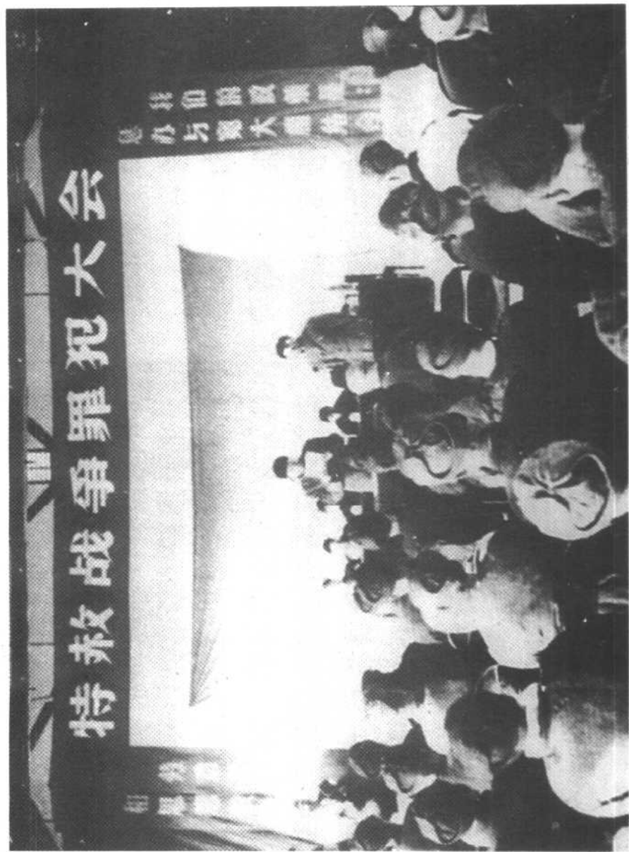
1959年底功德林监狱第一批战犯特赦大会现场