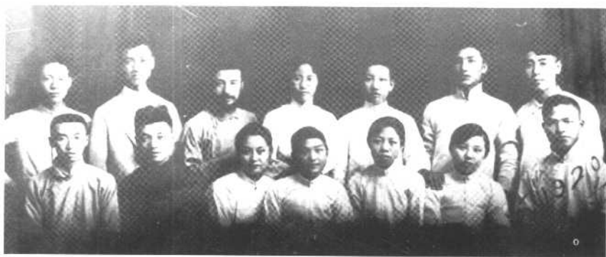
1919年9月，周恩來等在天津發起成立“覺悟社”。這是部分社員的合影，後排右一為周恩來。