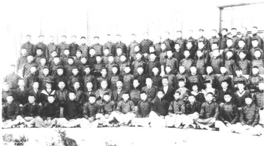
1919年9月25日，南開大學開學紀念留影，後排左一為周恩來。