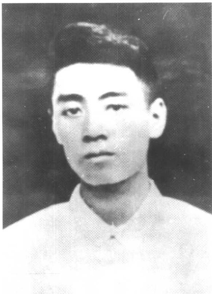
五四运动和南开大学时期的周恩来。