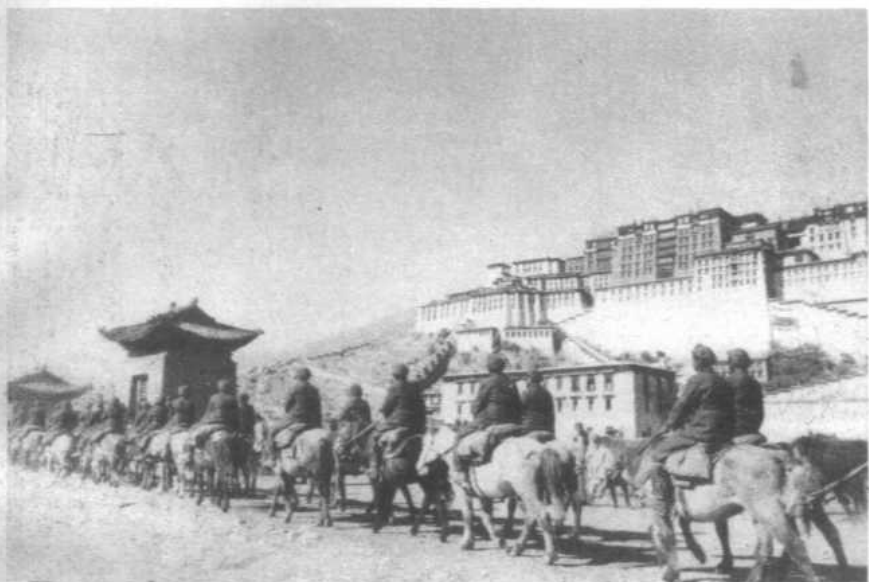
和平解放西藏。人民解放军翻越千山万水，胜利进入西藏拉萨。