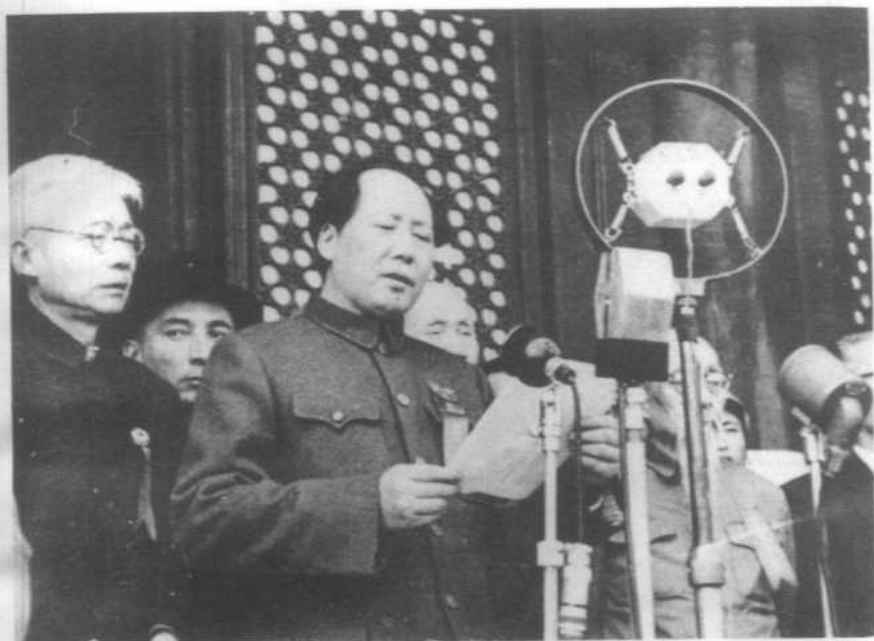
开国大典。1949年10月1日，毛泽东在天安门城楼上宣读中央人民政府公告。