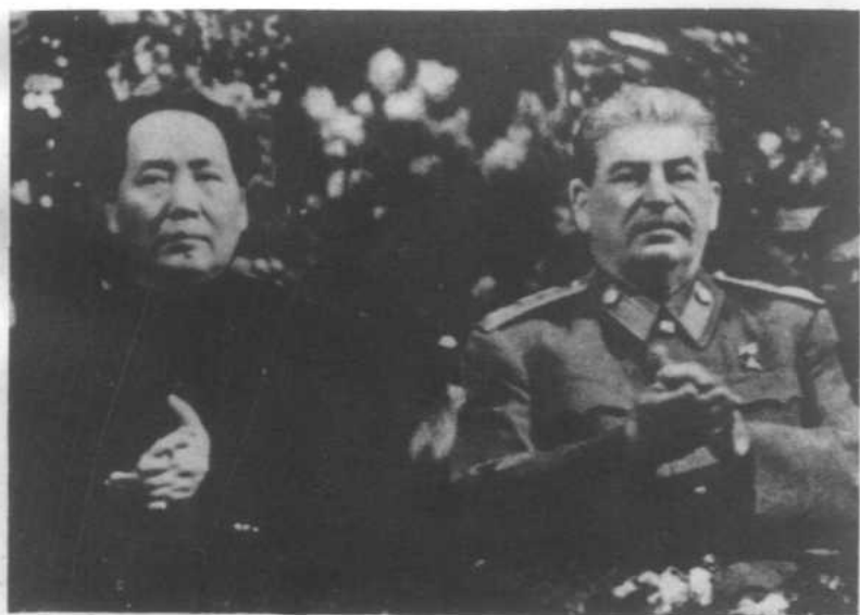
1949年12月，毛泽东在莫斯科庆祝斯大林70寿辰时和斯大林的合影。