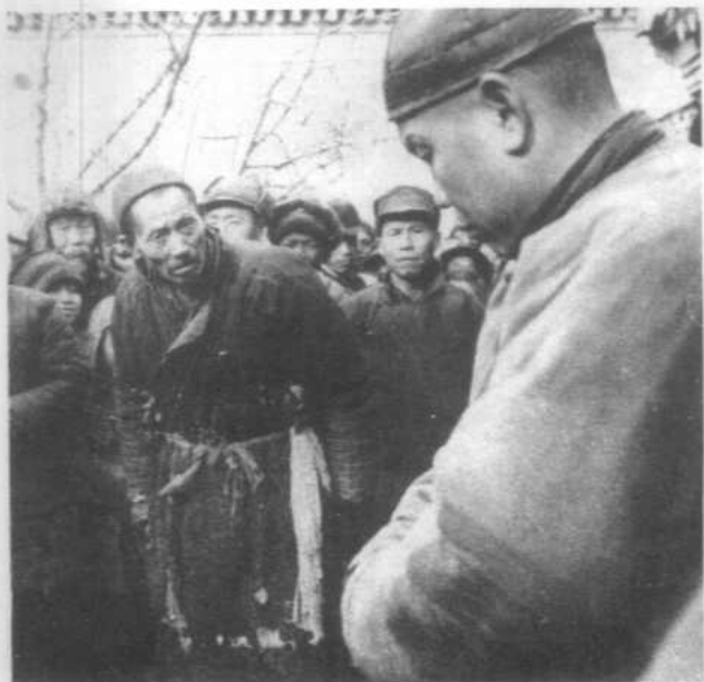
1949年在北京市郊某村， 农民召开大会斗争恶霸地主。