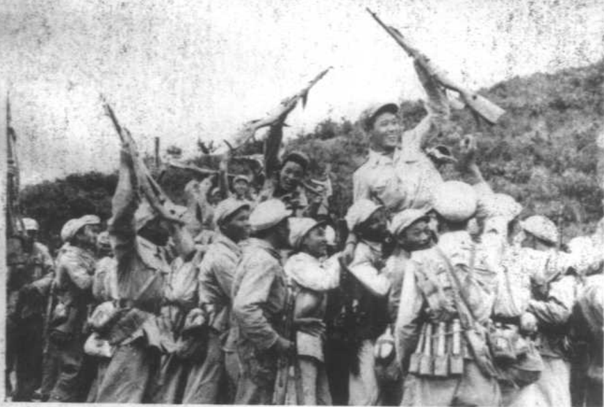
胜利会师。在朝鲜战场上，中朝两国部队胜利会师的情景。