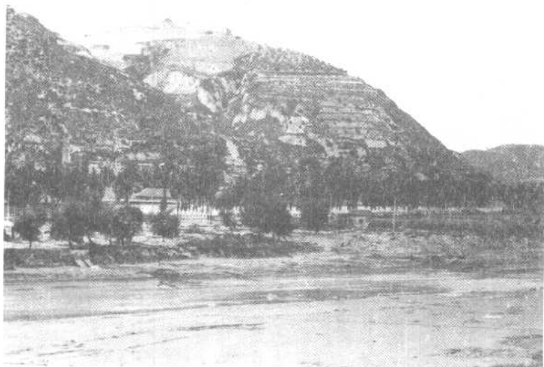
藍家坪延安文抗 旧址远眺。