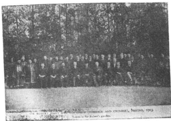
赫德在花园与中国海关全体同仁合影(1903年)