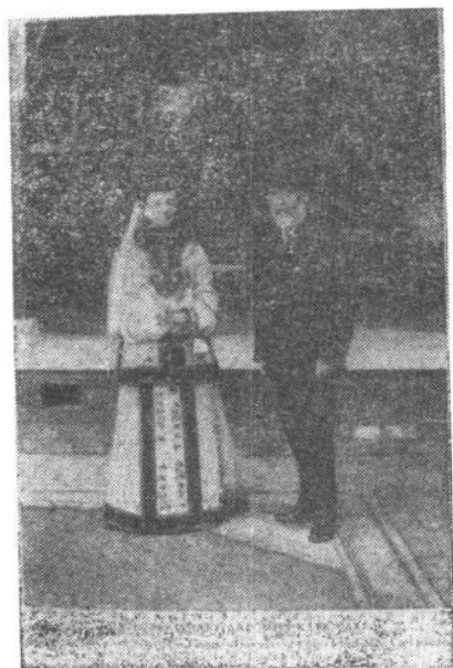
赫德与柯姑娘合影(1903年)。柯姑娘， 名凯瑟琳·奥古斯塔·卡尔，美国画师。 中国海关税务司柯尔乐之姐。1903年来华， 曾为慈禧太后画像。