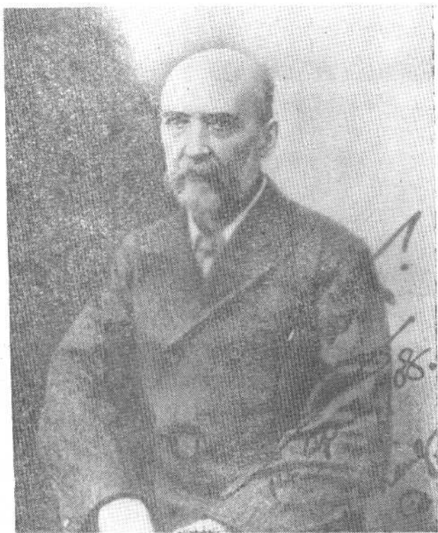
赫德摄于 1908 年