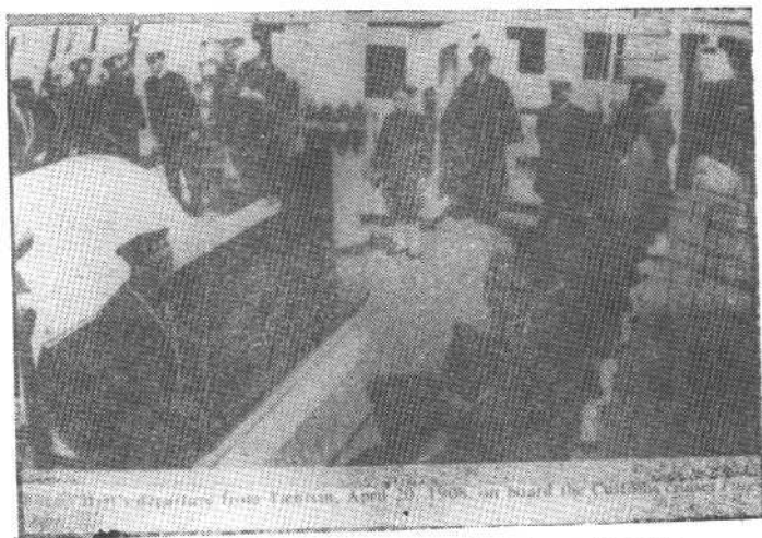
赫德 1908 年 4 月 20 日从天津乘船离华返英