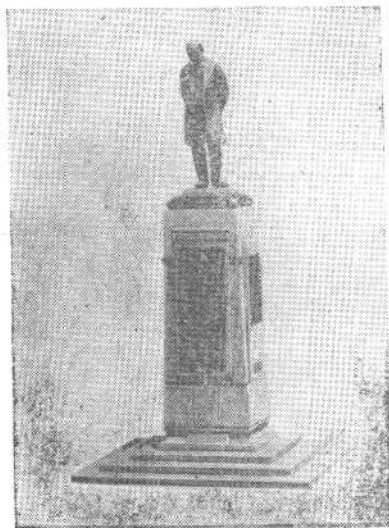
赫德铜像。座落于上海外滩， 「文化大革命」期间被毁。